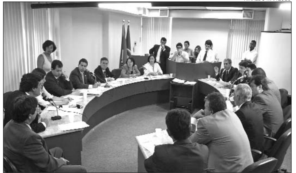
UNÂNIME - Proposta recebeu o "sim" do colegiado e seguirá para o Plenário

Os parlamentares ainda aprovaram o Projeto de Lei nº 1244/06, do Executivo, que concede reajustes salariais de até 10% para servidores estaduais. Entre as propostas distribuídas, está o Projeto de Lei Complementar nº 1247/06, da Mesa Diretora, prevendo aumento salarial de 10% para os servidores do Legisla-