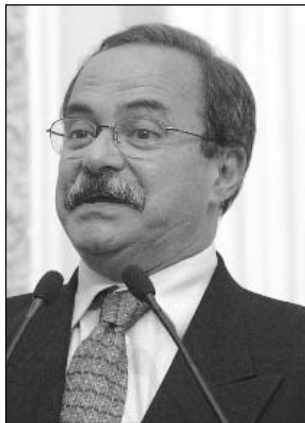
EURICO E MORAES - Citaram CPI dos Bingos e PMDB

Em depoimento à CPI dos Bingos, Francenildo desmentiu o ministro da Fazenda, Antônio Palocci, ao afirmar que ele frequen-