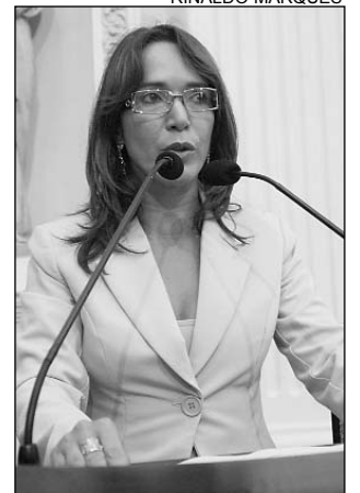
ELINA - Apoio às mudanças

"As alterações foram possíveis a partir de uma ação acordada entre a Secretaria Especial da Mulher e a sociedade civil. Durante a 2ª Conferência Estadual de Política para as Mulheres, uma comissão representativa, com 16 membros do Governo e da sociedade, foi implementada", lembrou a socialista, acrescentando que o grupo foi idealizado para abranger todo o Estado, sendo formado por duas representantes das quatro grandes regiões - Sertão, Agreste, Metropolitana e Zona da Mata. Na conferência, também ficou estabelecido o edital de seleção das entidades que integrarão o conselho.