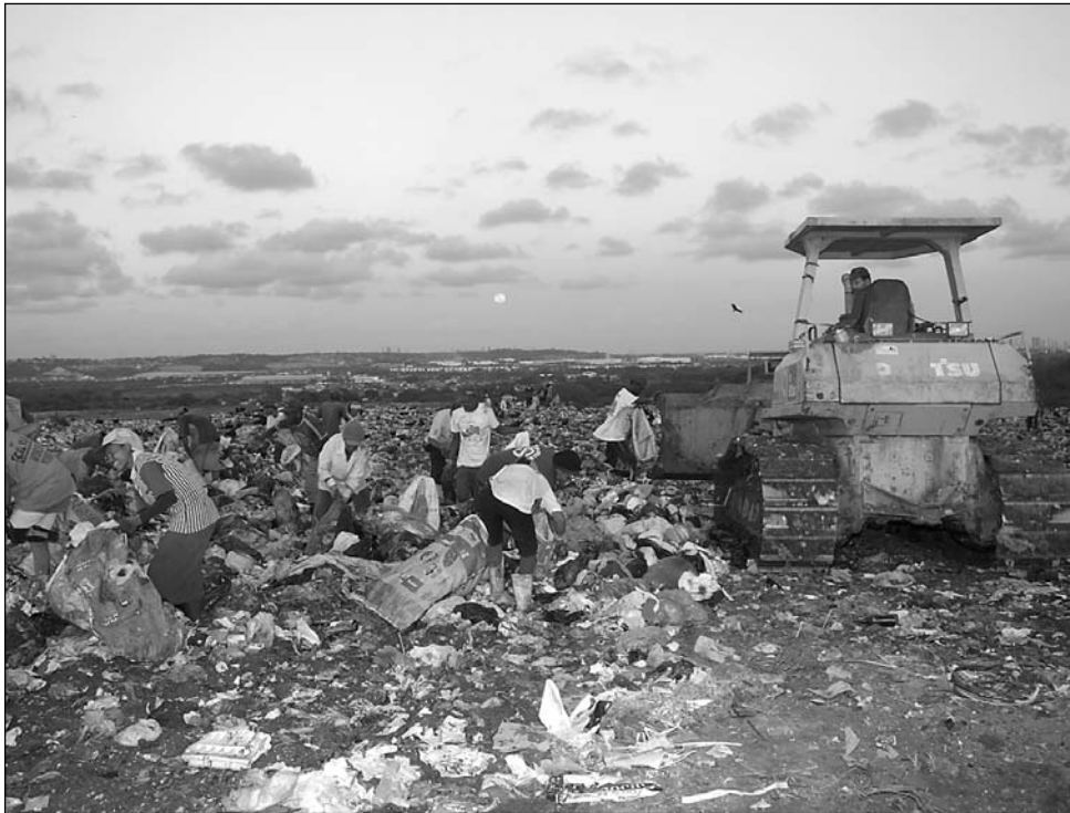
LIXÃO - Muitos catadores disputam espaço com máquinas e urubus para garantir o sustento