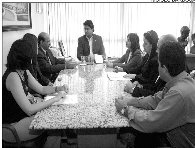
OAB - Grupo avalia maneiras para alterar MP federal

O grupo defende que as áreas urbanas sejam excluídas das determinações da MP, porque os municípios que são cortados por rodo-