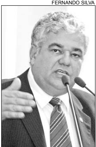
DESFILES - Sem estrutura

O tucano ainda lamentou o fato de alguns blocos tradicionais precisarem encerrar as atividades por conta das dificuldades financeiras. "Com mais de 80 anos de existência, o Bloco das Flores passou mais de 15 anos sem desfilar e só retornou há pouco tempo, graças ao apoio de amigos", lembrou.