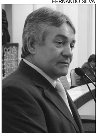
CRÍTICAS - Izaías Régis

Apesar de haver água nas bacias que abastecem o município de Garanhuns, no Agreste de Pernambuco, os habitantes sofrem com a falta do produto nas residências. A denúncia é do deputado Izaías Régis (PTB). "Há mais de 30 anos que a rede de distribuição e as estações de tratamento foram construídas para atender a cerca de 20 mil ligações. Porém, atualmente, essa mesma rede contabiliza mais de 72 mil ligações, sem que a Companhia Pernambucana de Saneamento (Compesa) faça praticamen-