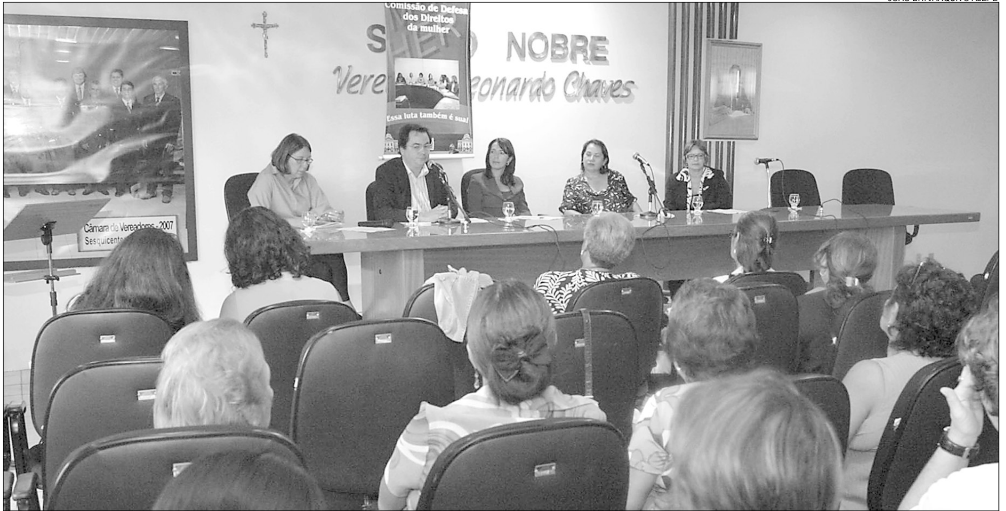
CARUARU - Colegiado debateu o tema na Câmara Municipal de Vereadores, no dia 13 de junho. Dados apontam que 40% das famílias da região são mantidas por mulheres