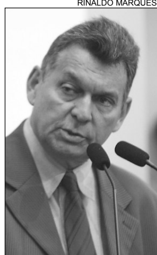
IMPACTO - Pereira

O investimento previsto é de R$ 4 milhões e estima-se a geração de 200 empregos diretos. De acordo com Pereira, os trabalhadores atuarão na montagem de desktops , notebooks , telefones celulares e suprimentos para memória e gabinete de computadores. “A chegada da Tupan Informática facilitará o acesso do sertanejo aos meios