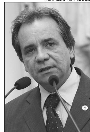
LITORAL SUL - Benefícios

Cabo de Santo Agostinho, Ipojuca, Sirinhaém, Rio Formoso, Tamandaré, Barreiros e São José da Coroa Grande são exemplos de destinos turísticos que, atrelados à beleza das praias, possuem riqueza histórica. “O Cabo de Santo Agostinho resgata o passado por meio das ruínas deixadas no período holandês”, comentou. Na avaliação do tucano, Porto de Galinhas é destaque nacional e internacional devido ao cres-