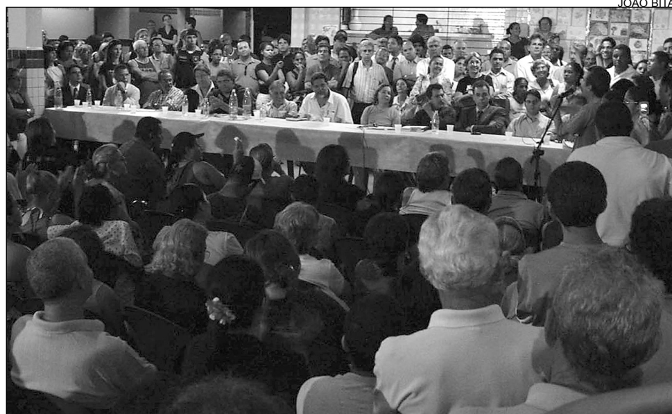
JABOATAO - Risco de desabamento deixou várias famílias sem ter onde morar

Por medida de segurança, cinco blocos foram interditados pela Defesa Civil de Jaboatão, no início deste mês. Ao todo, 160 famílias tiveram que deixar as residências. Mais de 15 mil pessoas moram no local. Durante a audiência, a presidente da Comissão de Cidadania, deputada Terezinha Nunes (PSDB), informou que o prefeito do município, Elias Gomes (PSDB), participou de um encontro, em Brasília, onde foi definido o percentual de contribuição