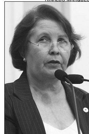
JACILDA - Pleito antigo

De acordo com a peemedebista, estão sendo realizados empreendimentos na região, como o Residencial Nova Paulista. Serão 80 mil unidades habitacionais, contabilizando cerca de 320 mil novos moradores. “Esse crescimento populacional, apesar