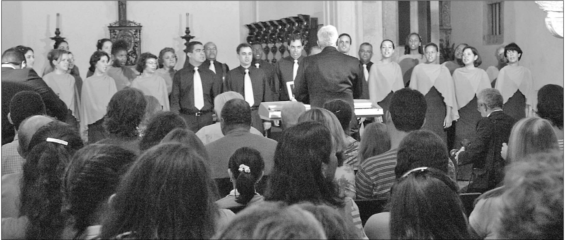
BALANÇO - Mais de 90 apresentações nos últimos anos, um CD gravado, outro em elaboração e repertório variado, com baião, frevo, xaxado e maracatu de autores consagrados