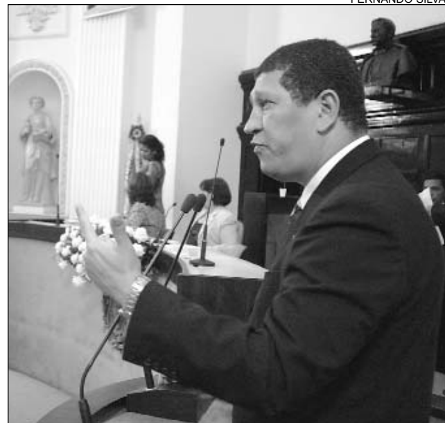
REFLEXÃO - Petista enfatizou importância do 'Sim'