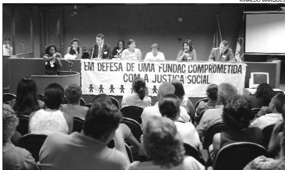
ESTRUTURA - Superlotação e falta de qualificação profissional também foram citadas