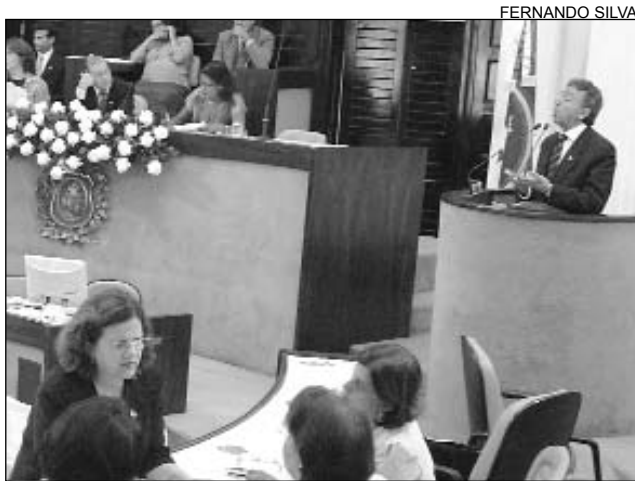
DESIGUALDADE - Ele diz que obras estruturais não bastam

Segundo o parlamentar, é necessário que se foque num novo modelo de políticas públicas. "Pode-se implantar a Hemobrás, o Pólo de Poliéster e a Refinaria de Petróleo. Se não pensarmos de forma diferente, daqui a dez anos, ainda estaremos registrando o aumento na concentração de renda e a ampliação das desi-