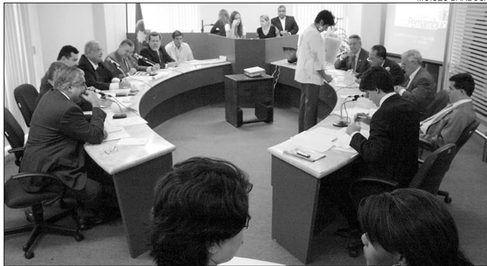
BALANÇO - Números apresentados à Comissão de Finanças pelo secretário da Fazenda

Leão, as áreas de Saúde, Segurança Pública e Educação são as que mais preocupam e são priorizadas pelo Governo. Este ano, foram gastos cerca de R$ 252,2 milhões com ações de saúde e R$ 948,4 com a manutenção e desenvolvimento do ensino. "Recebemos débitos da administração passada na ordem de R$ 243 milhões, um fato que pesa para as finanças de qualquer Estado, mas estamos tentando equacioná-los na medida em que o fluxo de caixa nos dá condições", afirmou.