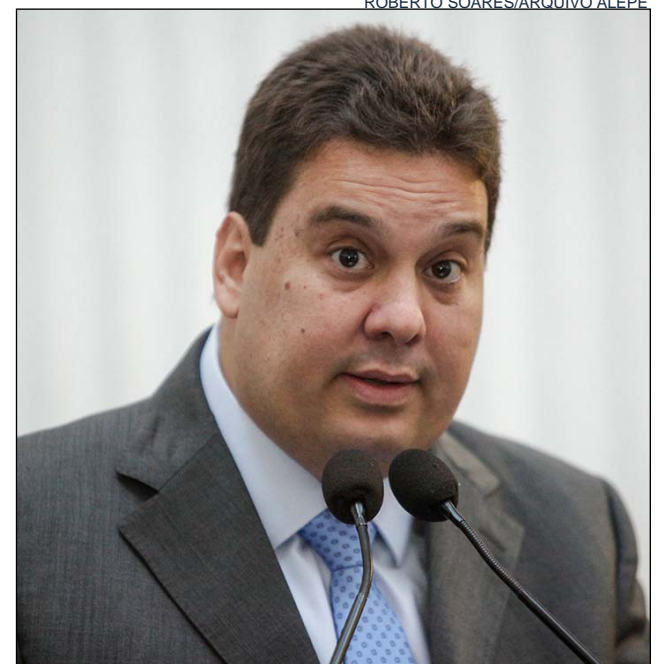
ACCIOLY - “Nosso Objetivo é contribuir para o salvamento de vidas”

Quanto mais rápido a manobra for aplicada, maior a chance de resol-