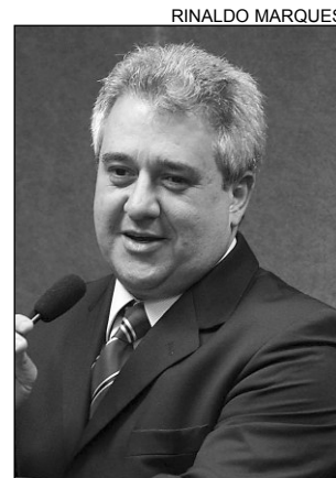
COUTINHO - Promessa

“Passados mais de dois anos de expectativas, assistimos à frustração. O Programa de Aceleração do Crescimento (PAC), por exemplo, não foi concebido como um plano de investimento gover-