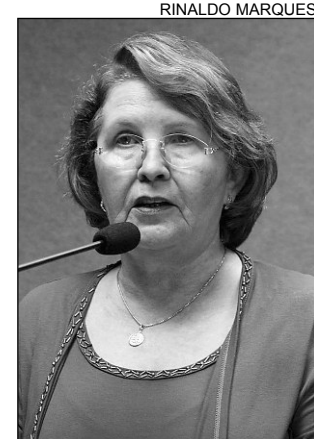
JACILDA - Buracos

QUALIDADE - A interrupção das obras, entre o Centro de Atenção Integral à Criança (Caic) e o cruzamento da Perimetral Norte, sob a justificativa de ser preciso material mais resistente, também foi citada. “Será que estamos diante de mais uma ação encaminhada de qualquer jei-