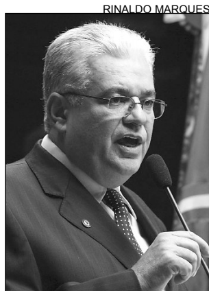
MORAES - Urgência

Moraes também avaliou que a má remuneração dos policiais facilita a convivência de alguns desses profissionais com o crime organizado. “Boa parte não possui formação adequada. Já o crime organizado, a cada dia, fica mais potente, comandando o tráfico de drogas nas grandes e pequenas cidades.”, observou. O fato de o Código Penal Brasileiro não responder aos atuais anseios da sociedade,