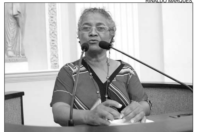
VÍDEO - População coletou imagens dos estragos

De acordo com a parlamentar, na última sexta-feira, um documentário elaborado pela população registrou imagens dos estragos. “As famílias alegam que a retirada da areia está sendo feita para as obras do Estaleiro Atlântico Sul e do Centro