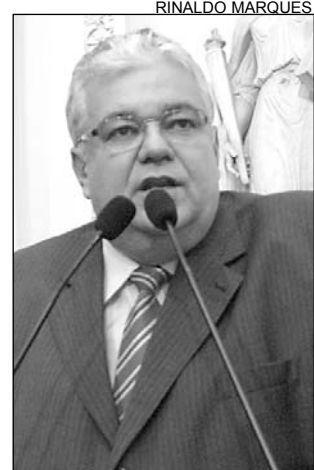
MORAES - Voto de Pesar

lhou em seis emissoras radiofônicas do Estado: Rá-