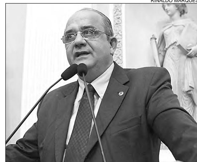
JABOATÃO - Lessa festejou reforma de unidade de saúde

“Passei por trechos críticos e não vi desordem. Sei que essa foi uma solução emergencial, porém, é preciso reconhecer quando uma iniciativa dá certo. Esperamos que, com ou sem chuvas, possamos ter homens orientando o trânsito nos semáforos e nos cruzamentos viários”, complementou.