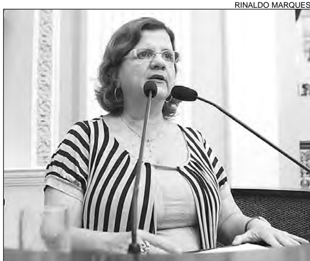
FÉ – Teresa citou formatura de sacerdotes e sacerdotisas

Na ocasião, foram entregues os certificados à primeira turma do curso para sacerdotes e sacerdotisas, ministrado em convênio entre a Organização das Nações Unidas para a Educação, a Ciência e a Cultura (Unesco); Universidade Católica de Pernambuco (Unicap) e a Fundação de Ensino Superior de Olinda (Funeso).