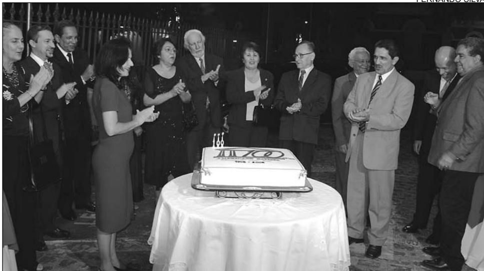
BOLO - No final da cerimônia, todos se reuniram no pátio para cantar parabéns