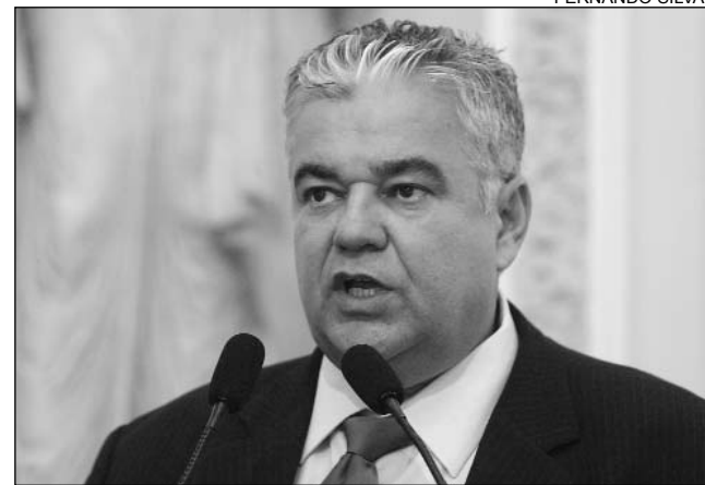
MORAES - Elogios aos que administram a entidade