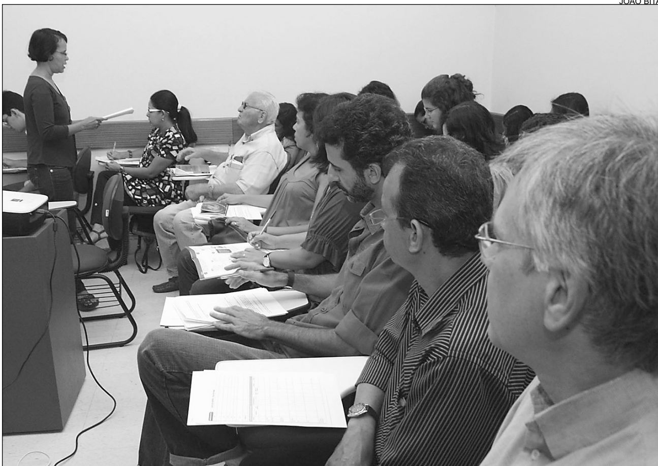
ESCOLA DO LEGISLATIVO - Integrantes da Assistência de Comunicação Social foram os primeiros contemplados

Sociedade tem até 2012 para se familiarizar com as regras