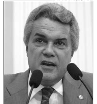
DEPUTADO - defesa do PT

(PTB), que presidiu parte da reunião plenária, disse que "a Reforma Política precisa ser discutida respeitando a realidade de cada Estado".