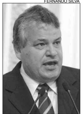
LEANDRO - Importância

Na conferência, estão sendo discutidas ações para a efetivação dos direitos dos idosos em diversas áreas, como previdência social, saúde, educação, cultura, esportes e