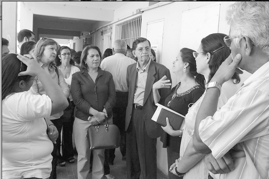
DEBATES - Impasse envolvendo moradores de Suape motivou audiência pública (acima), em março. Ao lado, o colegiado discute a superpopulação nas unidades da Fundac

citadas. A questão da segurança, por exemplo, tem sido o carro-chefe de nosso colegiado. Fizemos di-