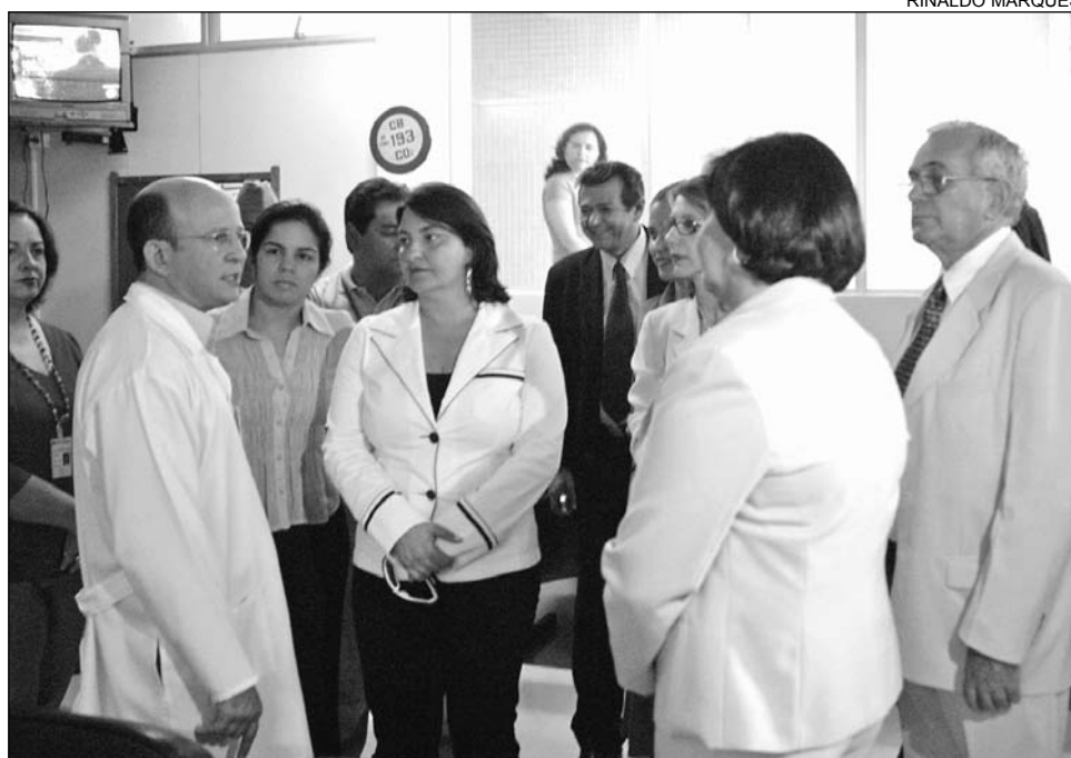
HSE - Uma das unidades inspecionadas pelo colegiado foi o Hospital dos Servidores do Estado

A Comissão também realizou nove audiências públicas para debater diversos assuntos. O processo de liquidação da Admed, a municipalização dos Hospitais Barão de Lucena e Geral de Areias e os Consórcios Intermunicipais de Saúde foram alguns deles. Nesta última, foi discutida a questão do repasse da ad-