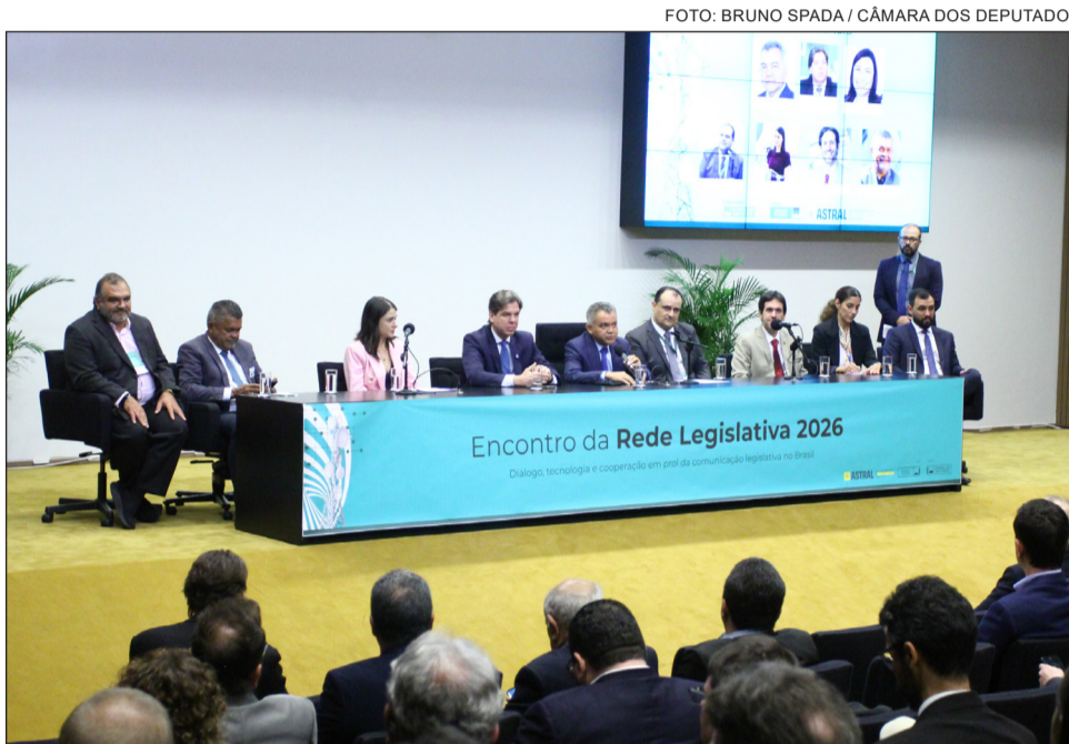
REDE – Evento realizado em Brasília teve assinatura de acordos para ampliar o sinal da TV Alepe e demais emissoras públicas

Brasil Digital, será possível que as pessoas acompanhem o trabalho de seus representantes nos parlamentos, inclusive câmaras municipais, ampliando a transparência, aproximando o Legislativo da população e valorizando a cultura local por meio de conteúdos diversos”, prosseguiu Nascimento.