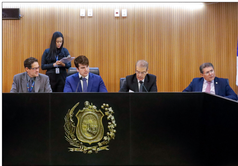
FINANÇAS - Colegiado também deu aval à proposta que amplia o quadro de servidores e cria 98 funções gratificadas no Ministério Público

Pelo texto do projeto, a gestão estadual tem o prazo máximo de dois anos para a construção e instalação dos Bombeiros no local, contados a partir do registro da escritura pública de doação. O projeto também obriga o governo estadual a manter o imóvel em bom estado de conservação e de uso, sob pena de reversão da doação.