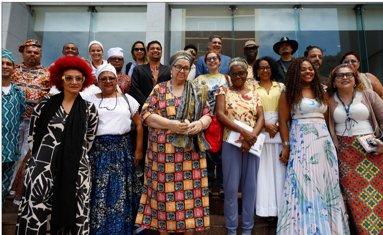
EDUCAÇÃO – Representantes de povos originários e religiões de matriz africana participaram do debate na Alepe

Essa perspectiva foi reforçada pela yalorixá Mãe