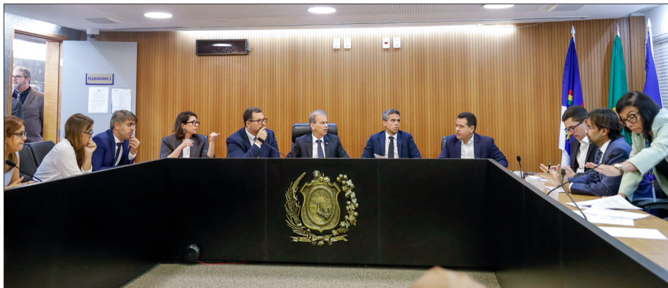
JUSTIÇA – Projeto acatado pelo colegiado cria cargos efetivos de analista e técnico ministerial no MPPE

O colegiado de Administração Pública aprovou ainda o Projeto de Lei Ordinária nº 4045/2026, que su-