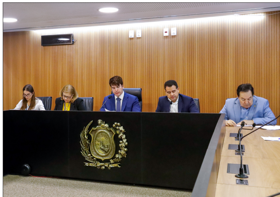
ADMINISTRAÇÃO – Deputados analisaram matéria relacionada à infraestrutura energética no município de Petrolina