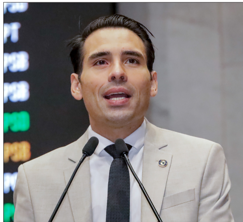
GASOLINA – João Paulo Costa registrou a criação de subsídio para produtores e fornecedores de combustíveis