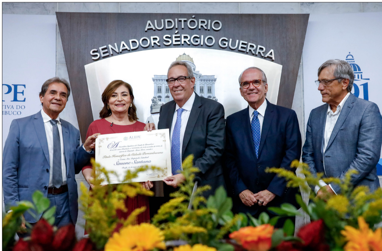
TRAJETÓRIA – Participantes externaram reconhecimento à atuação da parlamentar na medicina e na vida pública