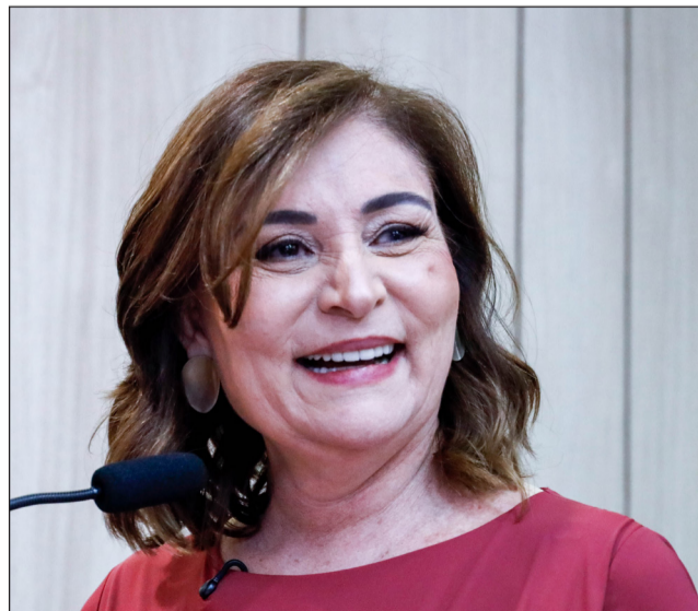
ATUAÇÃO - Deputada preside a Comissão de Ciência e Tecnologia e coordena frente parlamentar