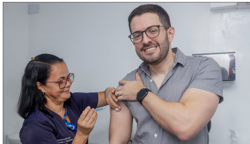
ATENDIMENTO – Sala disponibiliza vacinas oferecidas pelo SUS sem agendamento