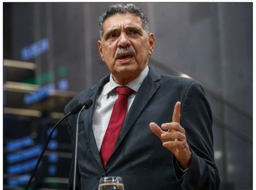
ÍNDICES – João Paulo destacou avanços socioeconômicos do Governo Lula, como a redução da pobreza e a retomada de investimentos