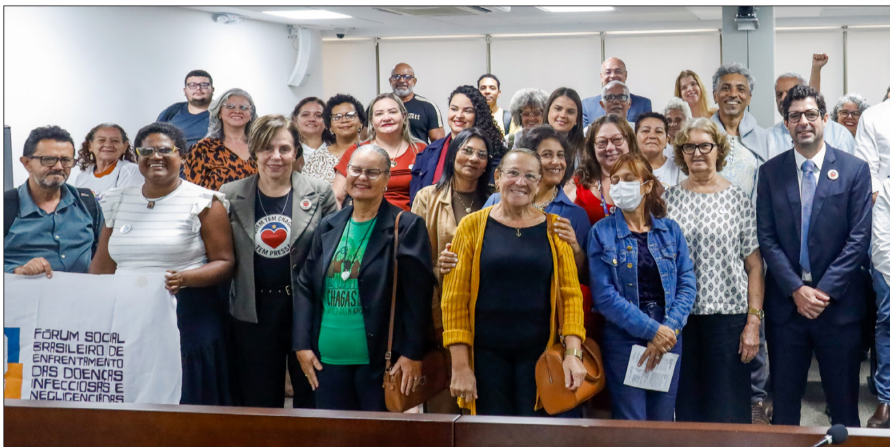
DEBATE - Audiência pública discutiu estratégias de prevenção, diagnóstico e tratamento da doença

A iniciativa, financiada pelo Ministério da Saúde, tem como foco ampliar o acesso ao diagnóstico, ao cuidado contínuo e à informação. A ideia é definir um fluxo de tratamento e prevenção que sirva como parâmetro para o combate à doença, usando os dados obtidos em municípios das regiões Nordeste e Centro-Oeste, onde há maior in-