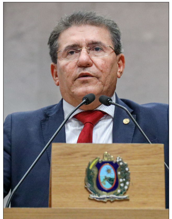
CRISE – Luciano Duque alertou para riscos à economia e defendeu um “entendimento em favor do povo”