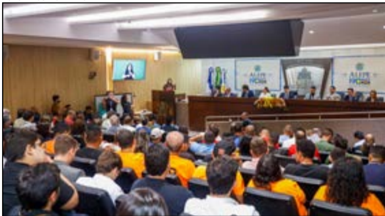
IPVA - Em novembro, o grupo convocou uma audiência pública sobre projetos de isenção do tributo.