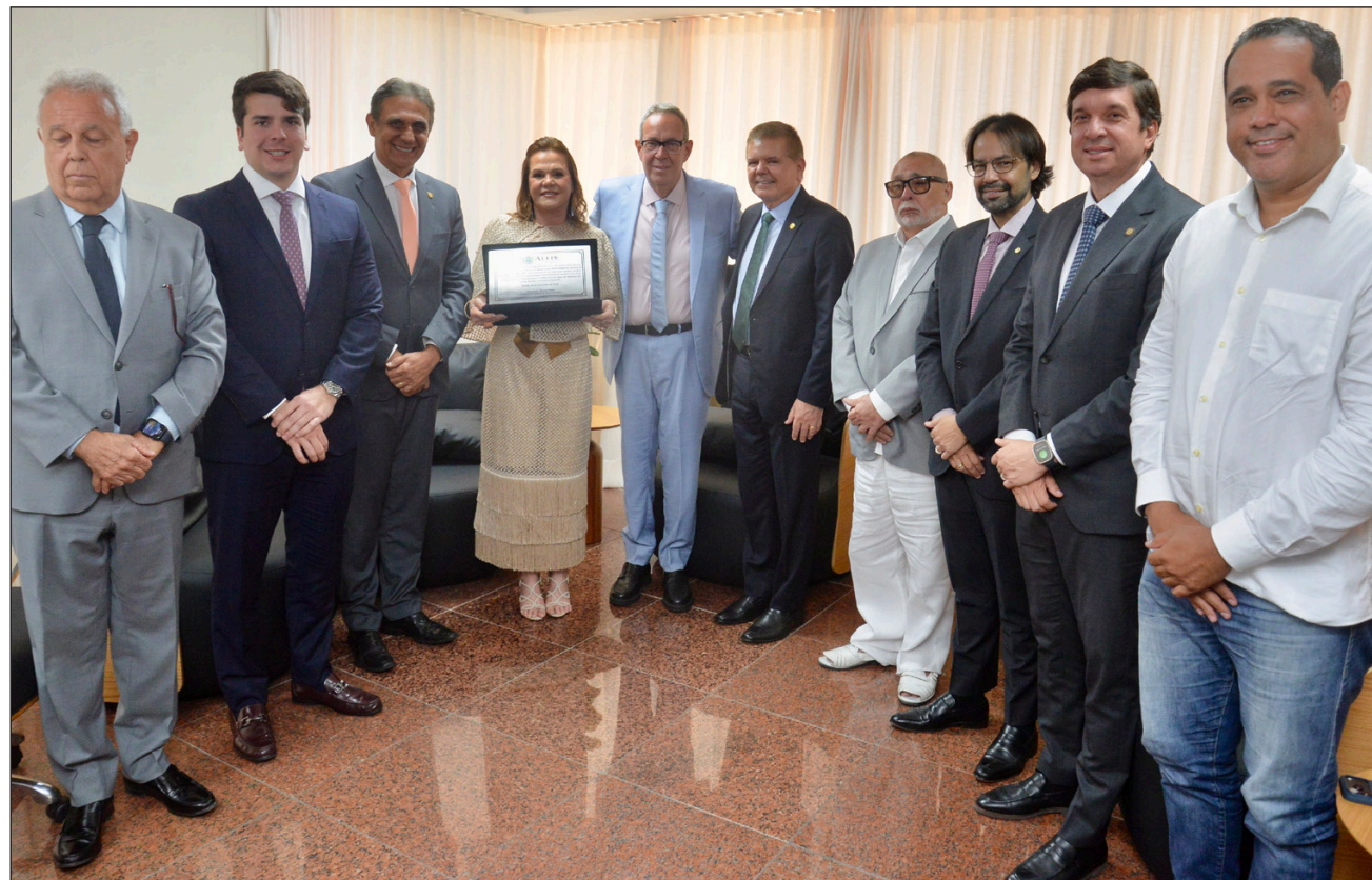
RECONHECIMENTO – Entrega do voto de aplauso na Alepe contou com a presença de vários deputados

A AAJUPE mantém ainda parcerias com órgãos e