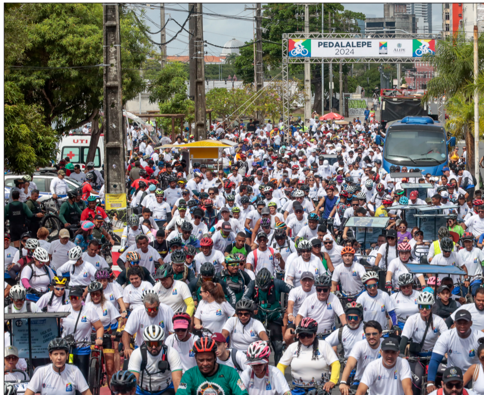
ITINERÁRIO – Os ciclistas percorreram 7,7 km no centro do Recife, na manhã do último domingo

As ruas do centro do Recife amanheceram tomadas por 2.500 ciclistas que participaram do PedalAlepe 2024 – Circuito Frei Caneca, no domingo (28). Gratuito, o evento foi aberto à população e marcou as comemorações em torno dos 189 anos da Alepe e dos 200 anos da Confederação do Equador, ambos celebrados em 2024.