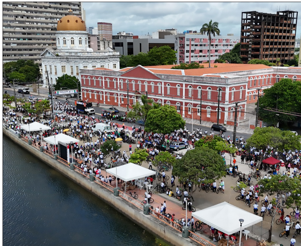
SOLIDÁRIO – O passeio ciclístico que fez o Circuito Frei Caneca integrar as comemorações dos 189 anos da Alepe