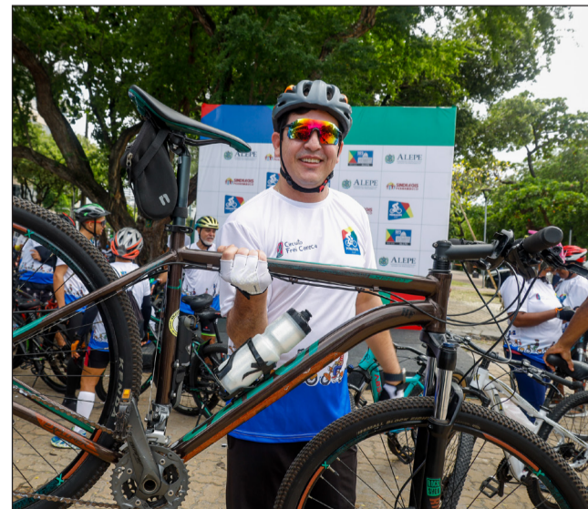
BIKE EM MÃOS – O deputado Henrique Queiroz Filho representou a Mesa Diretora da Alepe no passeio ciclístico

No PedalAlepe 2024, houve a distribuição de 10 mil copos de água, e 200 pessoas estiveram envolvidas na produção do evento. O passeio ciclístico teve sua primeira edição em 2023, com 1.500 participantes que percorreram 5 km do percurso pelo centro da cidade. Foram sorteados uma bicicleta e vouchers de descontos no Instituto Movimento e nas academias We Crossfit e Treno Fitness.