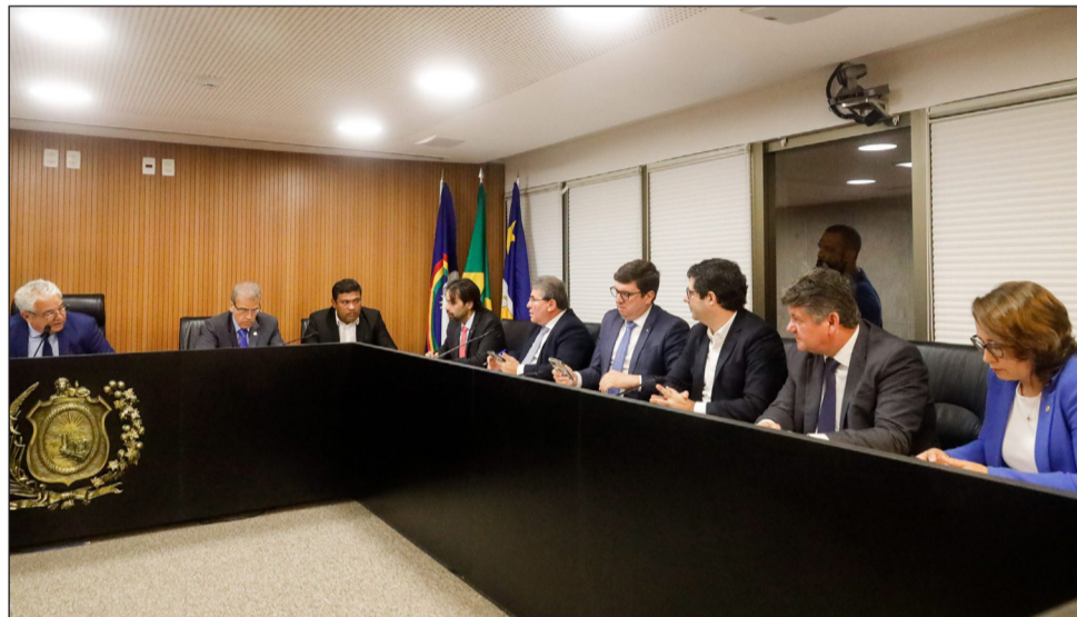
AVAL – Colegiado de Justiça da Alepe julgou constitucional a antecipação do fim do mecanismo para 2025