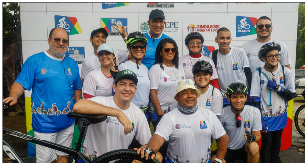
CAMPEÕES – No final do evento, dez participantes foram contemplados com bicicletas novas