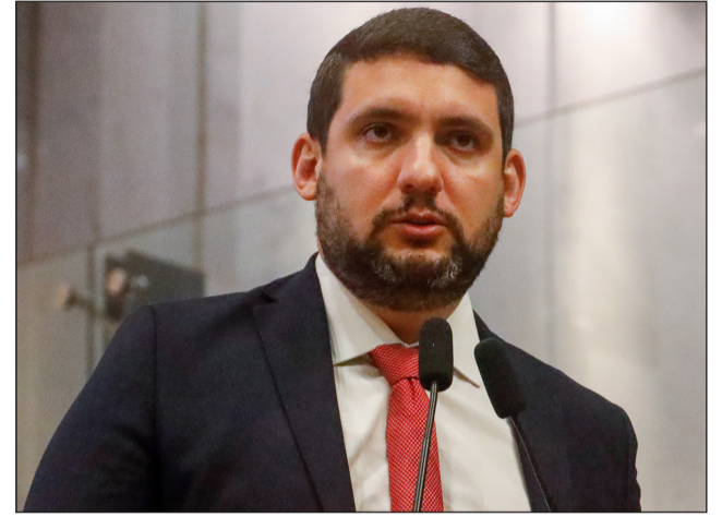
FUTEBOL – Romero Albuquerque criticou os questionamentos da Justiça Desportiva ao Sport

Já o deputado Romero Albuquerque criticou o Superior Tribunal de Justiça Desportiva (STJD) pela cobrança de garantia de segurança absoluta na partida entre Sport e Ceará pelas quartas de final da Copa do Nordeste, prevista para acontecer na Arena de Pernambuco na semana que vem.