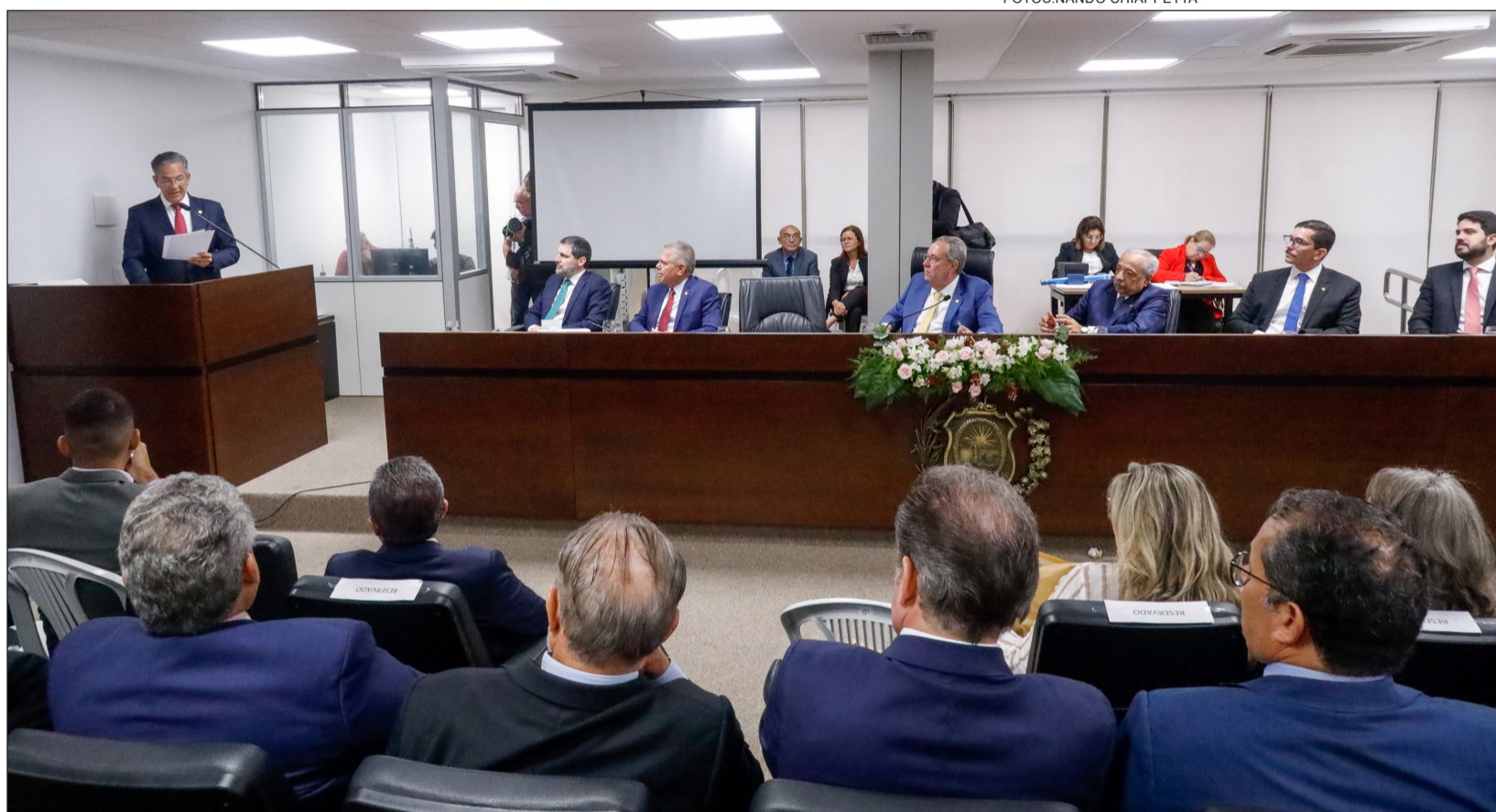
HOMENAGEM – Solenidade foi prestigiada por autoridades políticas e dos meios jurídico e empresarial de todo o país