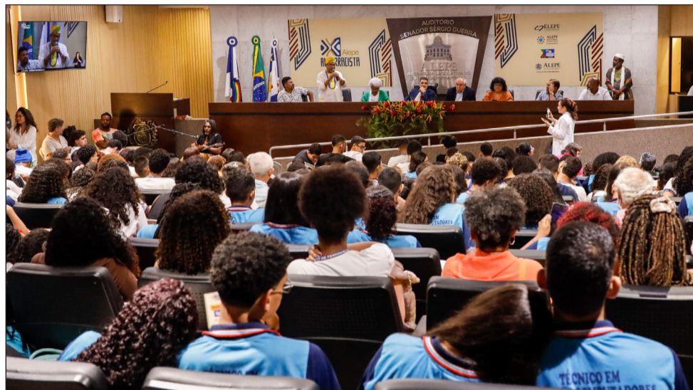
PARTICIPAÇÃO – Professores e estudantes marcaram presença no evento na Alepe