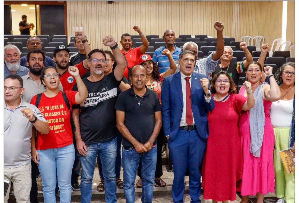
LÊNIN – Representações da esquerda em Pernambuco homenagearam ontem o centenário de morte do líder russo