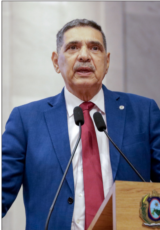
LIMINAR – Para João Paulo, decisão do STF pode ajudar no diálogo entre os poderes

“É importante que essa decisão seja como um instrumento de aprofundar o diálogo e, sempre que possível, evitar a judicialização do processo. Acho que nós podemos viver agora um clima de mais entendimento”, avaliou o parlamentar. Ele também registrou que também espera que essa postura de diálogo seja observada