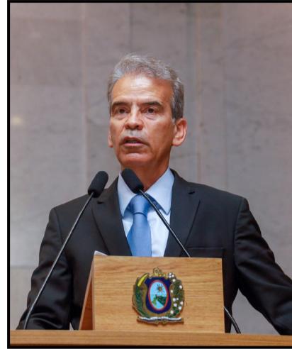
APOIO – Coronel Alberto Feitosa celebrou o ato público a favor do ex-presidente Bolsonaro

João Paulo (PT) voltou a defender as declarações do presidente Lula sobre o conflito entre Israel e o Hamas na Faixa de Gaza. Segundo o deputado, a ten-