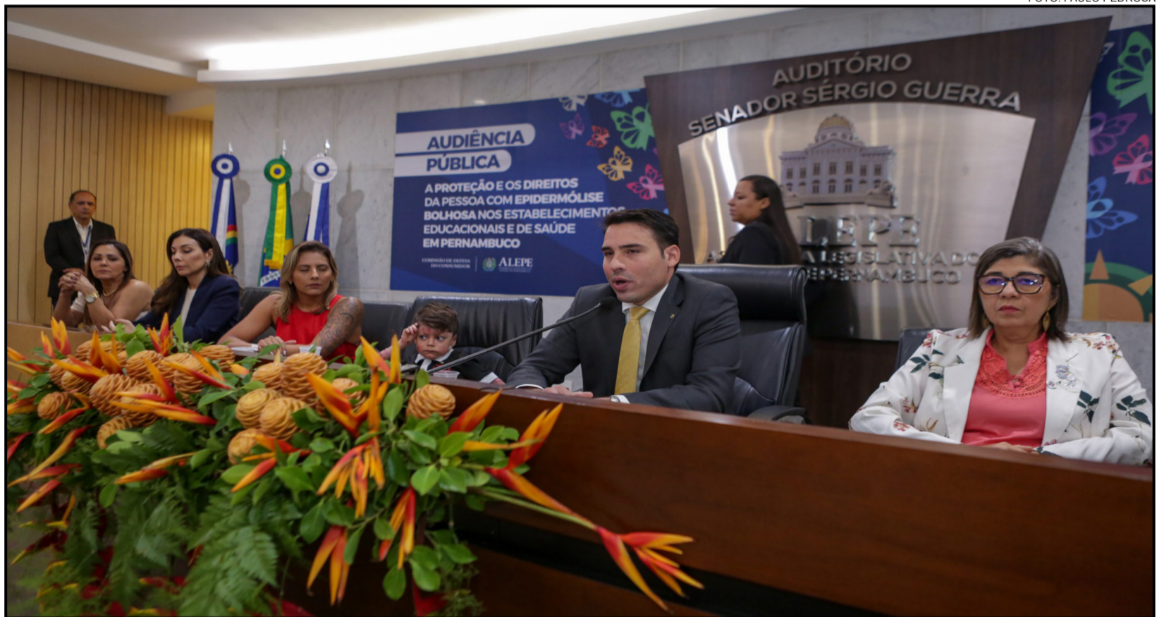
AUDIÊNCIA – Em dezembro, o colegiado debateu a proteção das pessoas com epidermólise bolhosa

Foram abordados temas como a importância do direito à informação, a necessidade de educação financeira e a Lei Federal 14.181/2021, que aperfeiçoa a disciplina do crédito ao consumidor e dispõe sobre a prevenção e tratamento do superendividamento. Também foi debatida a importância do programa Desenrola Brasil, do Go-