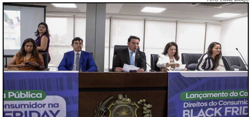
DEBATES – Vários assuntos de interesse do consumidor foram discutidos ao longo de 2023