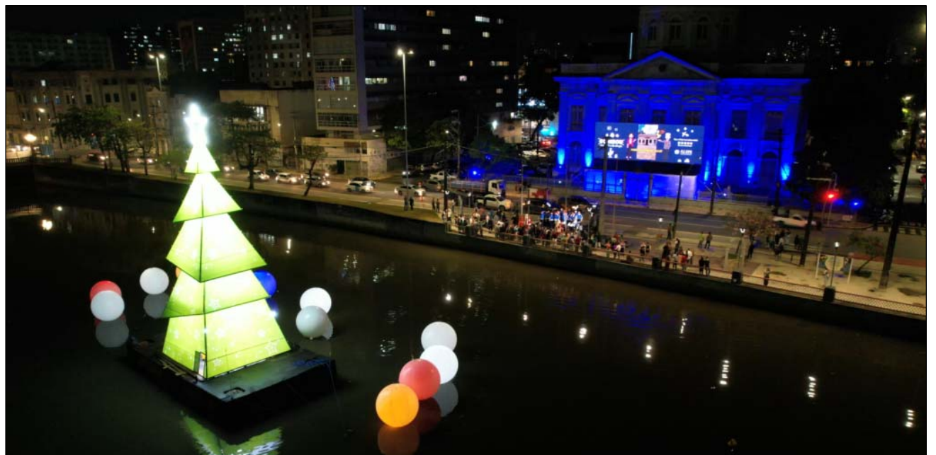
NOVIDADE – Árvore de 14m de altura no Capibaribe é destaque da iluminação de Natal

Para o superintendente-geral da Alepe, Isaltino Nascimento, 2023 foi um ano de completa sintonia entre a Alepe e os interesses do povo pernambucano. "Foi um período de muito trabalho e ações, on-