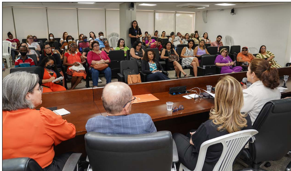
CRISE – Médicos, gestores e donos de clínicas debateram problemas do setor que atende 6,5 mil pernambucanos