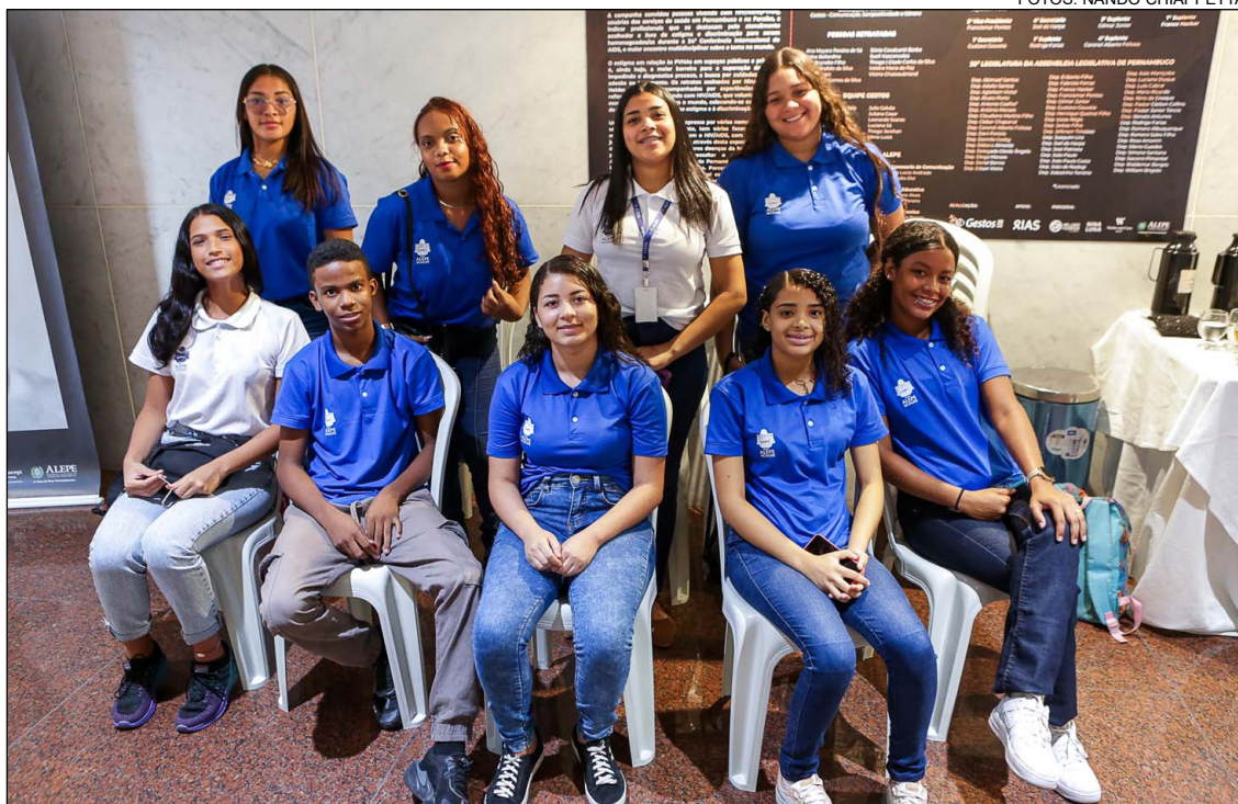
AÇÃO SOCIAL – Alepe Acolhe oferece estágio remunerado para jovens que vivem em casas de abrigo e aguardam adoção