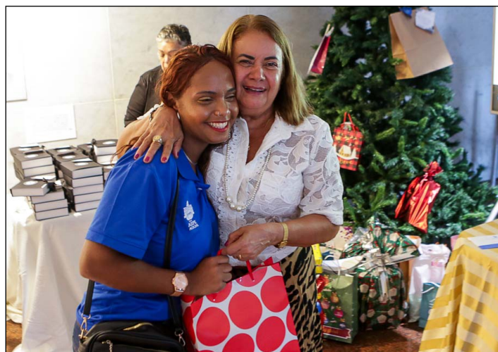
NATAL PRATEADO – Jovens beneficiados pelo projeto foram presenteados por familiares e cônjuges dos parlamentares