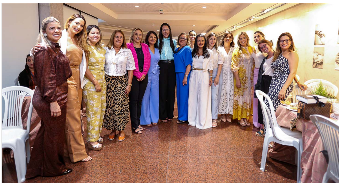
COMPROMETIMENTO – Familiares e colaboradores envolvidos na ação ressaltaram importância social do Alepe Acolhe