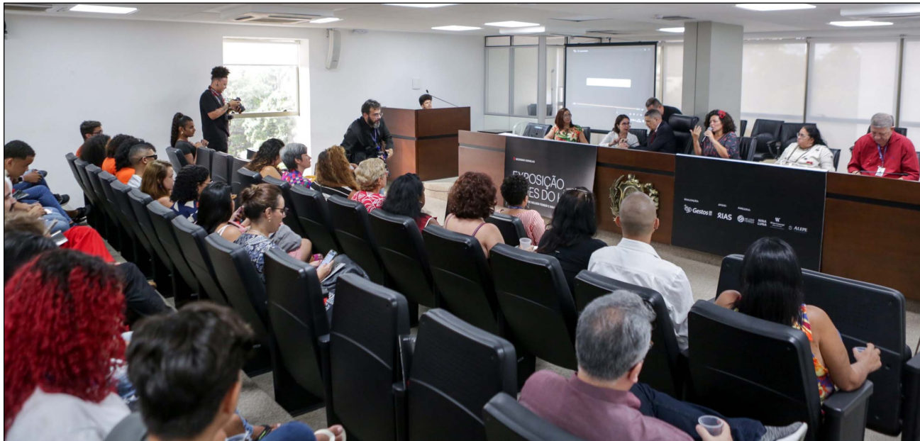
DISCUSSÃO – Debate sobre prevenção ao HIV e enfrentamento ao estigma marcou abertura do evento