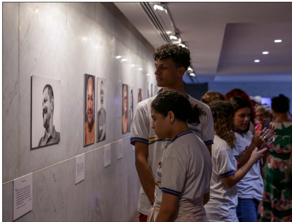
MOSTRA – Aberta ao público e gratuita, a exposição fica em cartaz na Alepe até o dia 15 de dezembro

“Ainda não vimos o avanço da educação civilizatória no Brasil. Pernambuco continua liderando a lista de estados do Nordeste com mais casos novos de HIV/Aids, ano após ano. Discutir a questão do enfrentamento ao estigma e ao preconceito é