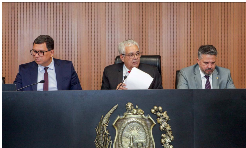
HOSPITAIS – Deputados discutiram sobre as gratificações para gestores de unidades de saúde do Estado

Também avançaram proposições que instituem programas sociais como Pernambuco Sem Fome e Fa-