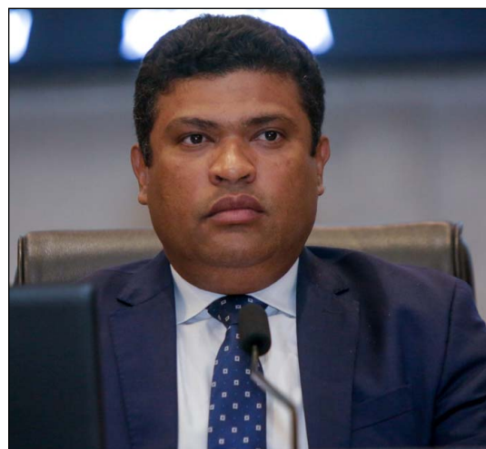
EMENDAS – Joel da Harpa celebrou recursos em benefício dos trabalhadores da área de segurança pública

Já a presidente da Comissão de Finanças da Alepe, deputada Débora Almeida (PSDB), agradeceu à Mesa Diretora, aos parlamentares e aos trabalhadores da Casa por todas as colaborações feitas à proposta orçamentária. “Trabalhamos duro desde o dia 5 de outubro, e o relatório final conseguiu atender aos interesses do povo pernambucano com a contribuição de cada deputado”, ressaltou.