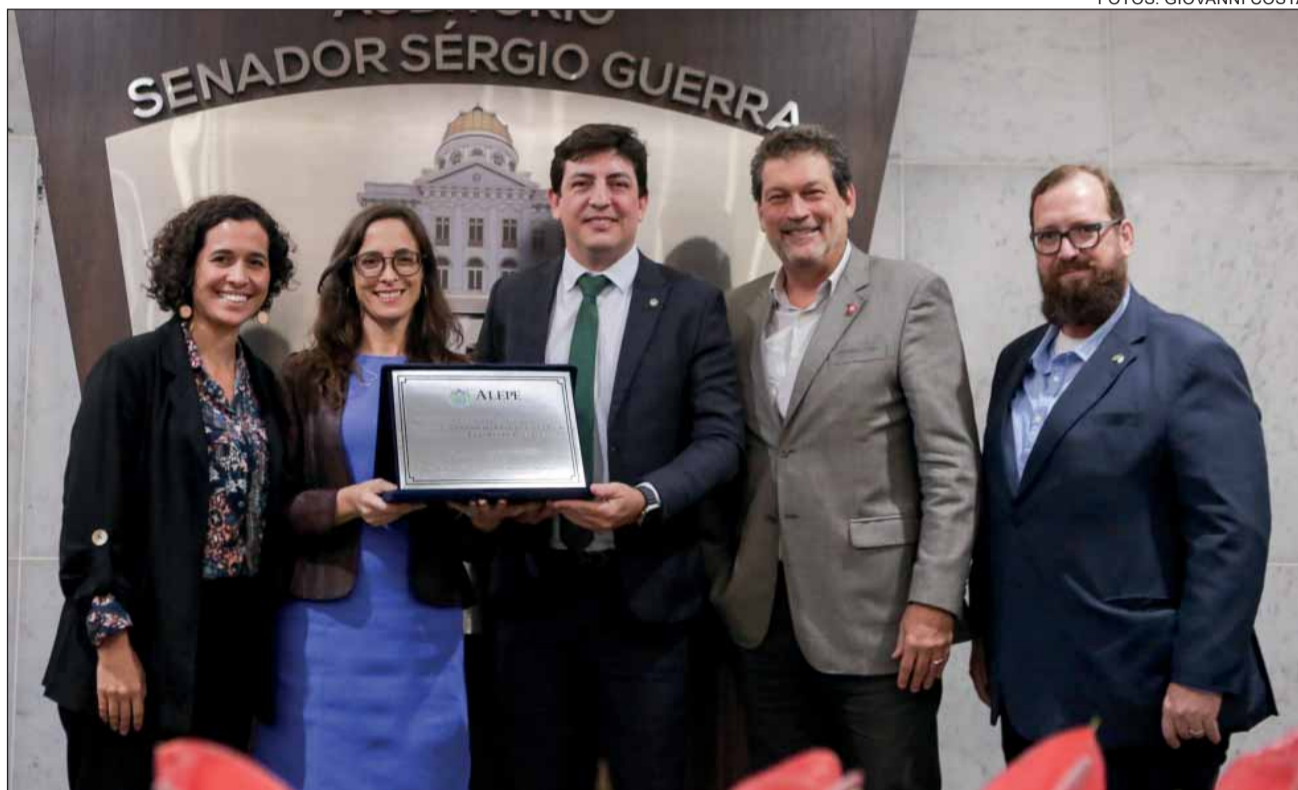
HISTÓRIA – Data é celebrada para recordar a Declaração de Iguazu, tratado assinado por Brasil e Argentina em 1985