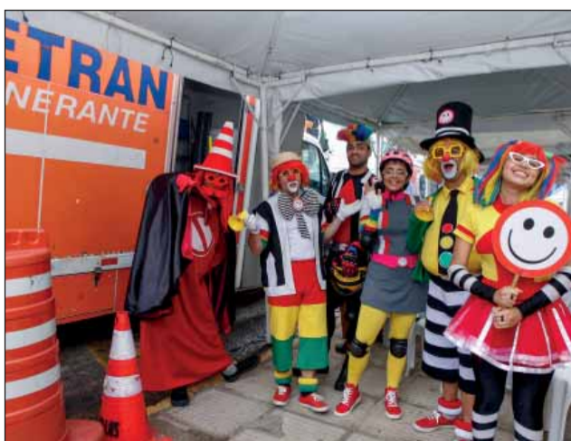
COOPERAÇÃO – A iniciativa conta com a colaboração de diversos parceiros institucionais