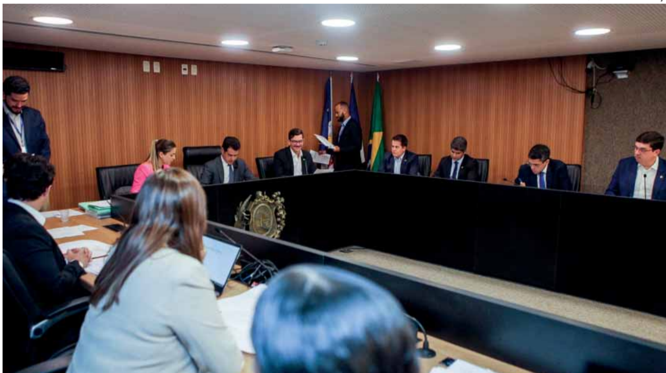
ADMINISTRAÇÃO – Colegiado se reuniu ontem para conhecer o balanço da gestão da Apac referente a 2023

Durante o debate com os demais parlamentares que integram a comissão, também foram abordados temas como o saneamento rural e o impacto da Escola de Sargentos do Exército que pode ser construída na Área de