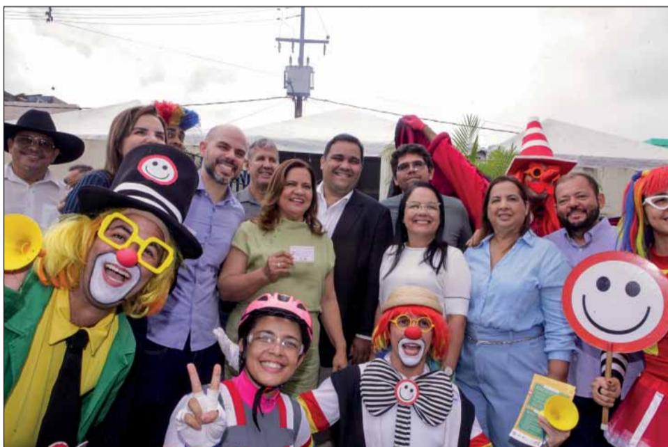
ESTREIA – O programa teve uma boa receptividade em Ipojuca, no litoral Sul, na terça-feira