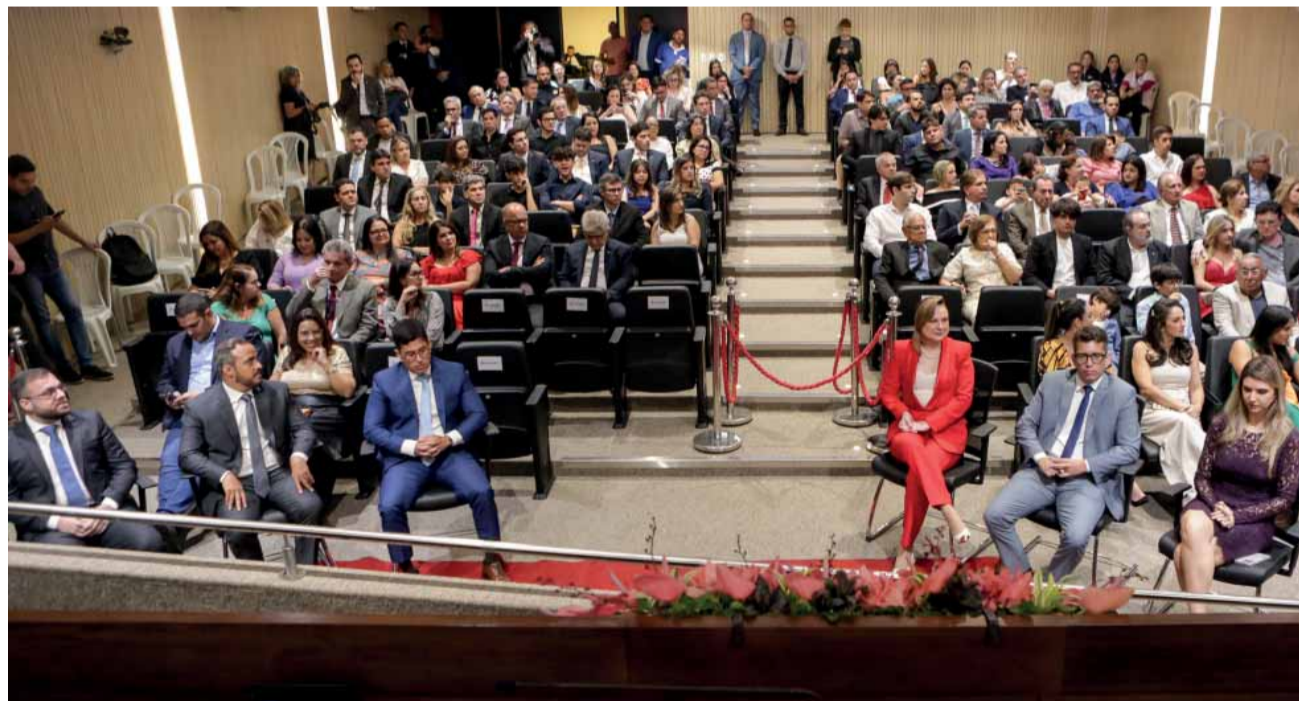
PRESENCAS – O Auditório Sérgio Guerra recebeu convidados e familiares dos promotores que agora são cidadãos pernambucanos

litária”. “Por isso, Pernambuco rende essa homenagem aos nobres promotores que, depois de muitos anos de estudo, saíram dos seus estados de origem para defender o nosso povo”, complementou o parlamentar.