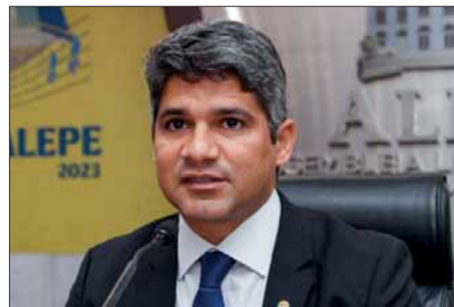
AUDIÊNCIA – Renato Antunes presidiu a reunião que contou com a presença de vários deputados