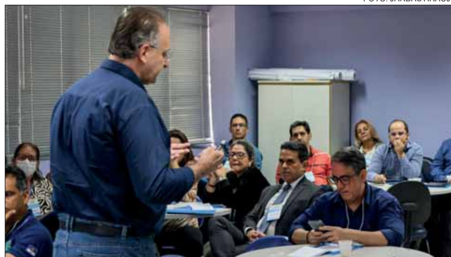
CAPACITAÇÃO – O módulo atual do curso tem como foco os setores de obra e engenharia

A Lei de Licitações e Contratos Administrativos unifica toda a legislação sobre compras públicas em todo território nacional. Com 194 artigos, o marco legal institui uma nova modalidade de contratação (diálogo competitivo), aumenta penas para crimes relacionados a licitações e contratos e exige seguro-garantia para obras de grande porte, entre outros pontos.