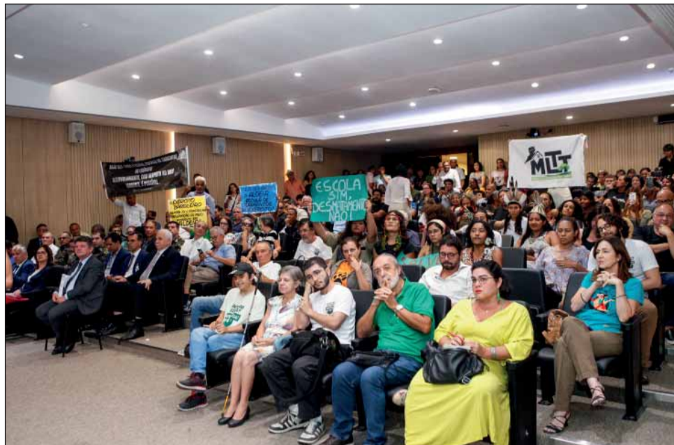
DEBATE – A localização da Escola de Sargentos do Exército está no centro das discussões

“O que propomos é ter o Arco Metropolitano arrodando a APA, passando na frente das várias alternativas possíveis. Se o Arco passar nesses locais, ele não só favorece e viabiliza a Escola de Sargentos, mas tem, também, o potencial de favorecer todo um conjunto de municípios que ali estão no oeste metropolitano sem qualquer plano de