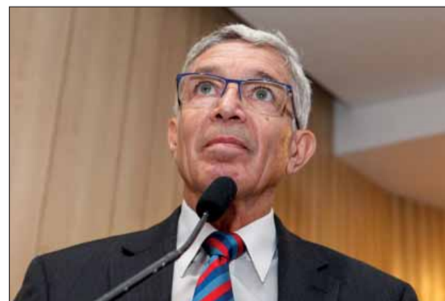
LOGÍSTICA – Estrutura de suporte para a Escola é um ponto basilar, explicou o general Joarez Júnior