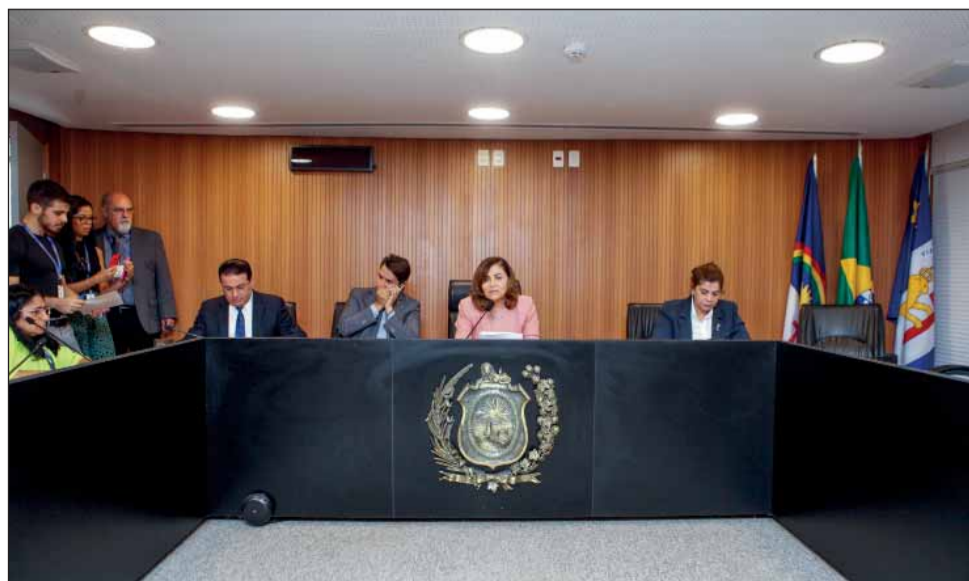
TEA – Comissão de Ciência e Tecnologia deu aval a projeto que pune discriminação contra autistas