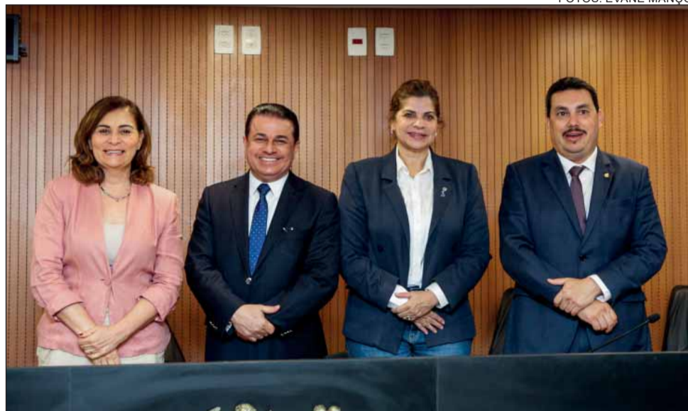
SAÚDE MENTAL – Comissão de Saúde aprovou projetos relacionados ao tratamento da depressão