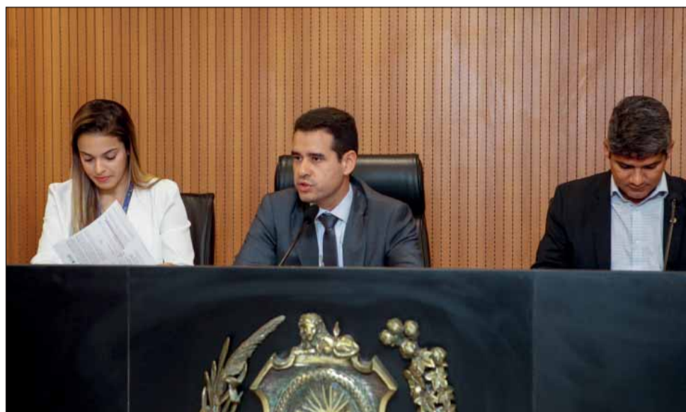
EDUCAÇÃO – Comissão de Administração ratificou ampliação de validade da autorização de escolas