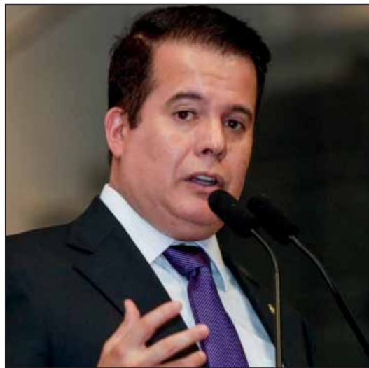
AGRESTE – Edson Vieira pediu ao Executivo a pavimentação de estradas vicinais da região

O deputado Edson Vieira (União) pediu ao Executivo estadual que priorize, no orçamento do próximo ano, a pavimentação de duas vias vicinais que cortam o Agreste pernambucano: as VPEs 189 e 187. Segundo o parlamentar, a intervenção permitirá ligar o município de Santa Cruz do Capibaribe à cidade paraibana de Barra de São Miguel, distantes cerca de 20 quilômetros. Na avaliação de Vieira, o investimento facilitará o escoamento da produção do Polo de Confeções do Agreste ao estado vizinho. “Levará mais desenvolvimento ao Agreste”, disse.