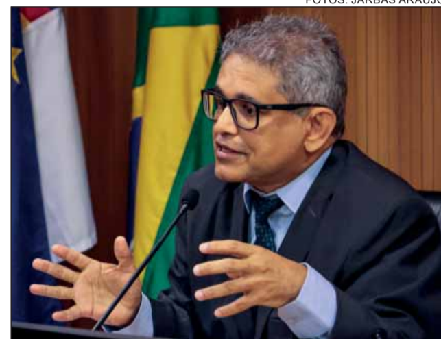
TECNOLOGIA – Juiz Flávio Fontes defendeu o reconhecimento facial nos estádios de Pernambuco

O deputado João de Nadegi (PV) destacou que a violência não ocorre apenas em dias e locais de jogos, e as brigas entre torcidas são marcadas pela internet. O par-