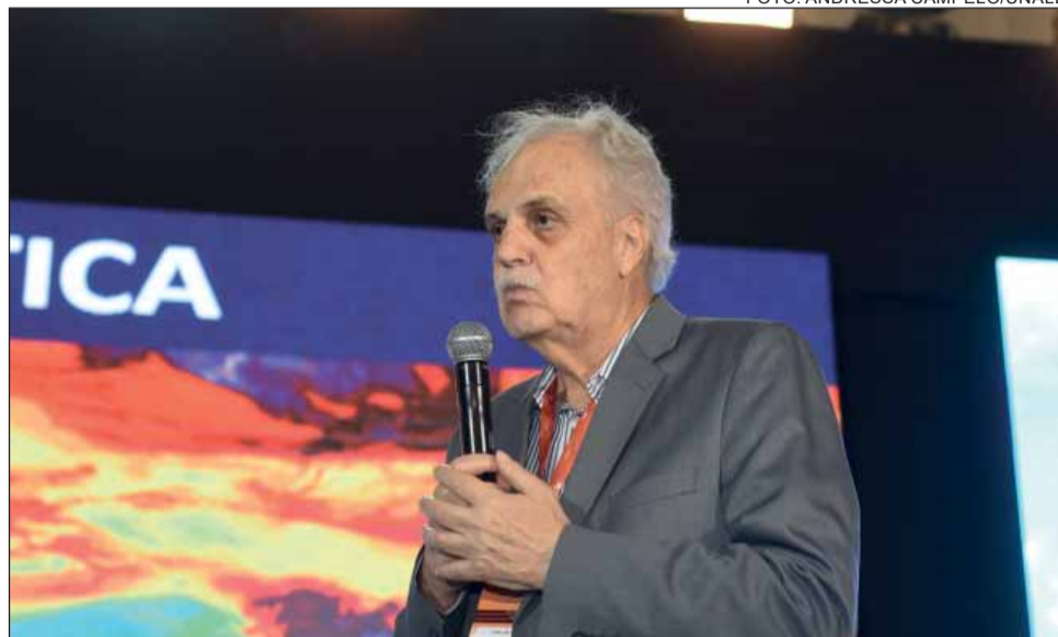
AQUECIMENTO – O pesquisador Carlos Nobre denunciou o aumento dos fenômenos extremos