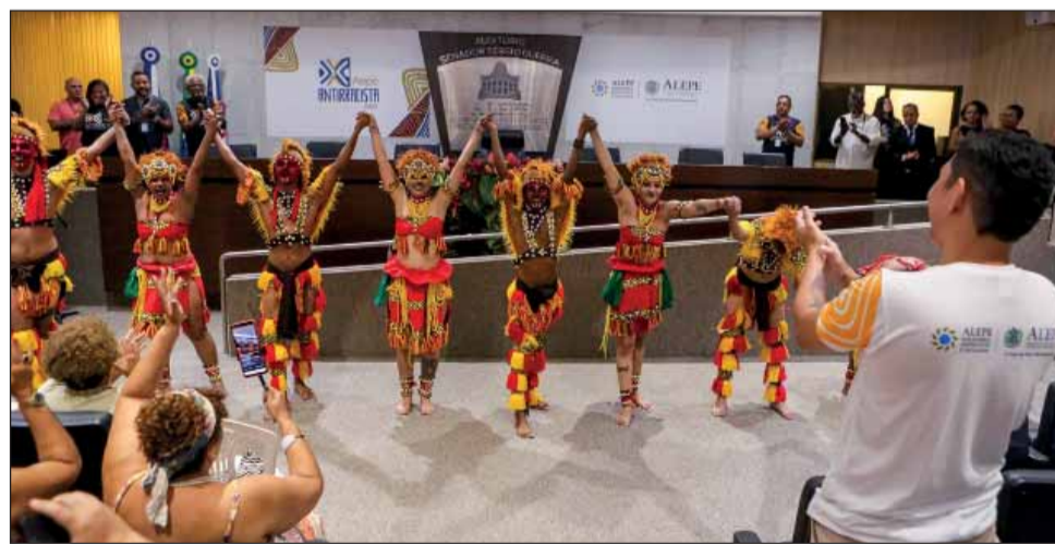
CULTURA - Além de palestras, o último dia do evento realizado pela Alepe contou com apresentações artísticas