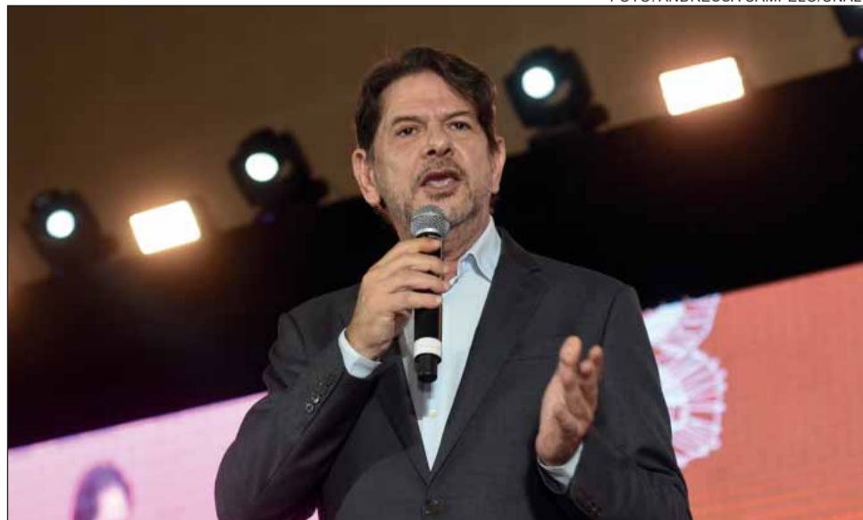
EMISSÕES – o senador cearense Cid Gomes defendeu o uso do hidrogênio verde como alternativa