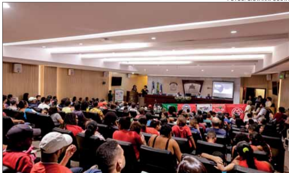
DISCUSSÃO – A Comissão de Cidadania da Alepe promoveu vários debates temáticos sobre o PPA

significativas para o ano que vem. Os recursos de execução obrigatória indicados pelos deputados aumentaram de 0,7% para 0,8% das receitas do Estado, alcançando R$ 257 milhões.