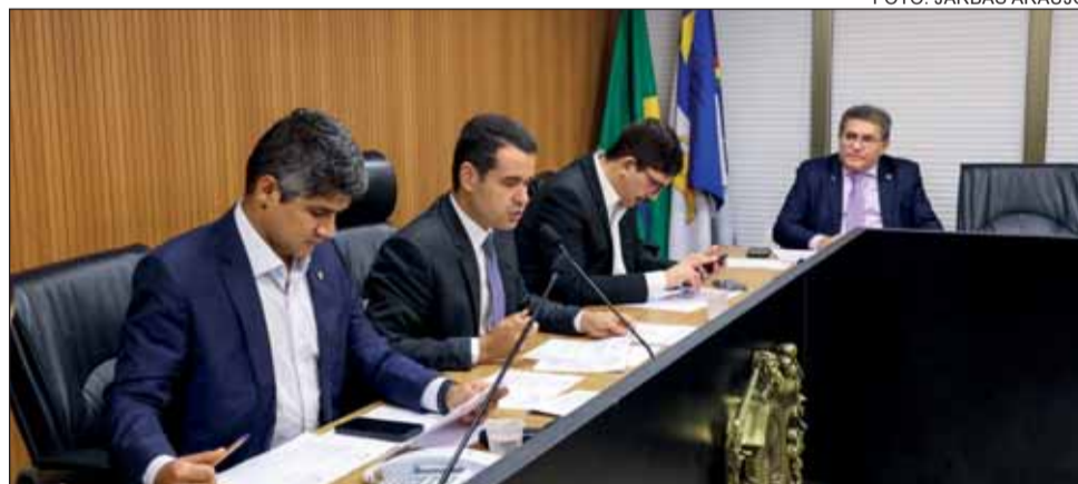
LEITE – Colegiado de Administração acatou alteração na Política Estadual de Aleitamento Materno