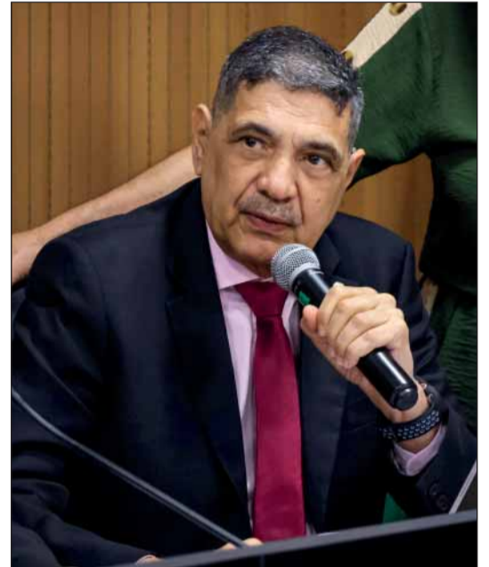
ADUBO - Relatório de João Paulo deu aval à proposta de proibição do uso da cama de frango em algumas cidades