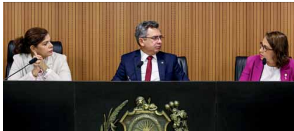
LATICÍNIOS – Comissão de Agricultura aprovou ontem projeto sobre derivados de leite artesanais