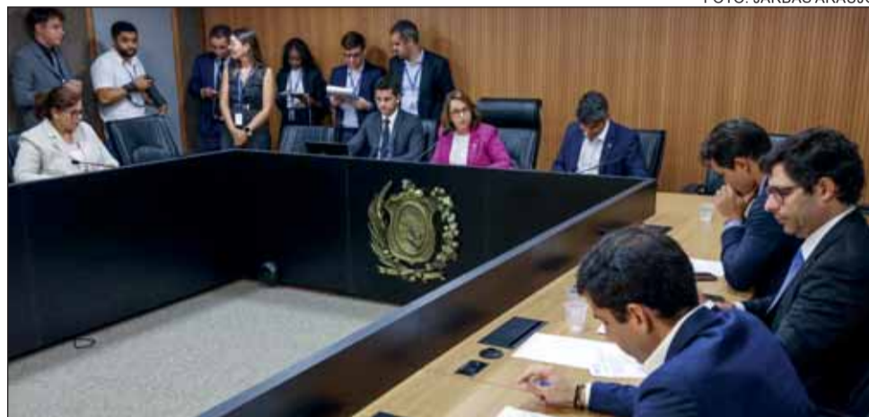
PRAZOS – Colegiado de Finanças divulgou o calendário de tramitação do Projeto da LOA para 2024