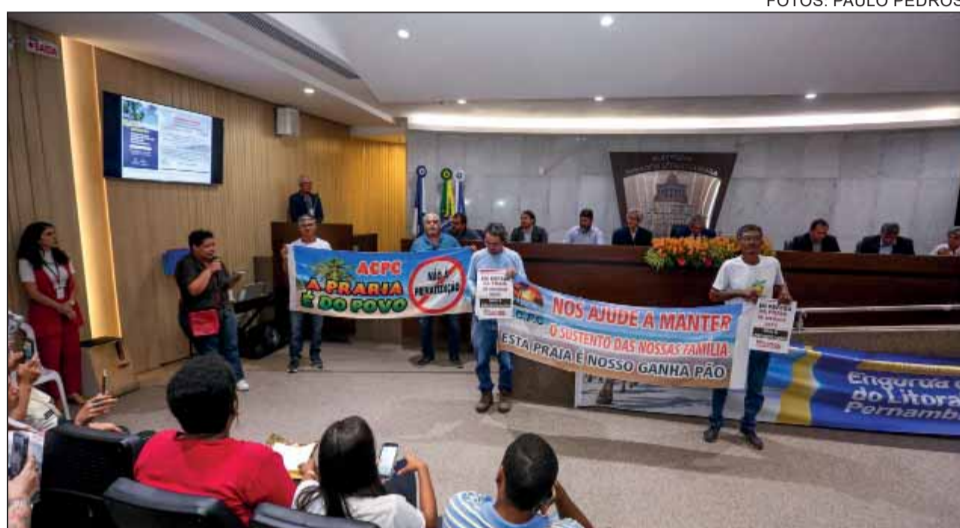
ALERTA - Representantes da sociedade civil manifestaram preocupação com o acesso das pessoas às praias