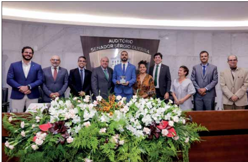
PRESTÍGIO – A solenidade reuniu várias autoridades e membros da comunidade acadêmica da UFPE