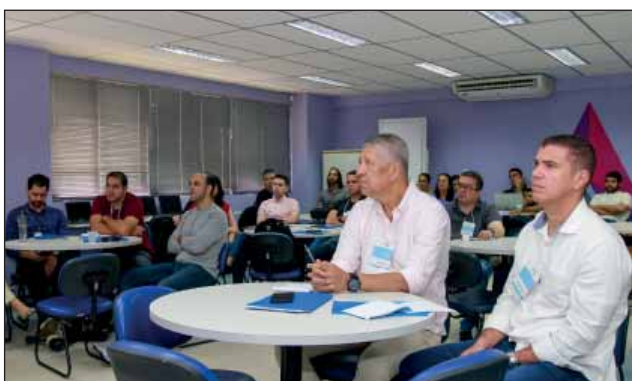
CONHECIMENTO - Os servidores receberam mais informações sobre o Plano Anual de Contratações

que consegue acompanhar o debate. Tenho certeza que os ensinamentos adquiridos aqui contribuirão para fortalecer ainda mais a gestão e a estrutura da Assembleia Legislativa”, disse o auditor do TCE-PE.