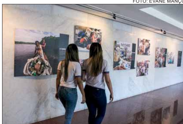
VISITAÇÃO – A mostra sobre a vida dos catadores segue em cartaz até o final deste mês na Alepe

Além das fotografias e do recebimento de um catálogo com conteúdo relacionado ao tema, os estudantes puderam assistir a um minidocumentário