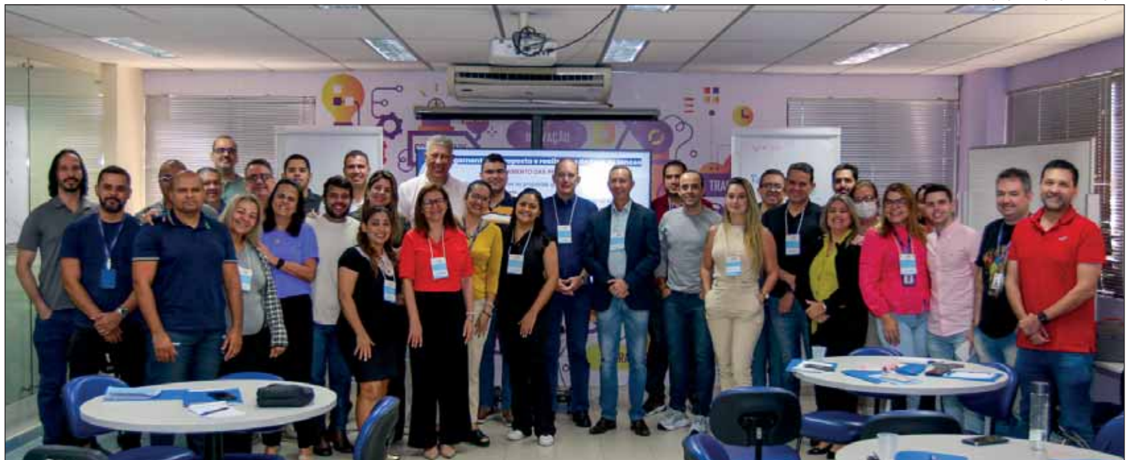
FORMAÇÃO – O curso encerrado ontem foi uma parceria entre a Alepe e o Tribunal de Contas do Estado

O facilitador da atividade falou da boa recepção dos participantes do curso ao conteúdo programático. “Percebe-se que a Alepe tem um quadro bem estruturado, com um bom conhecimento,