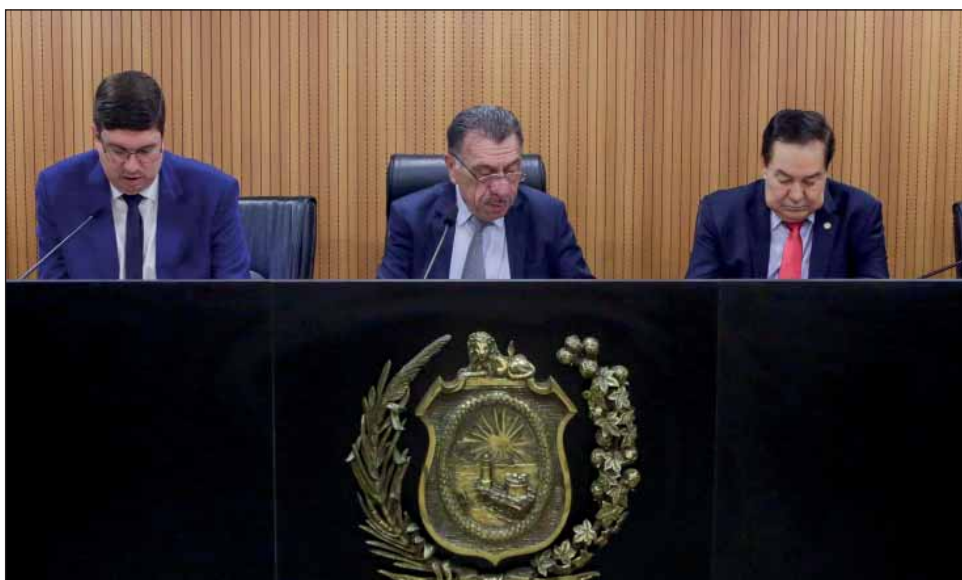
EXECUTIVO – Colegiado de Assuntos Municipais ratificou proposta que incentiva a educação infantil no Estado

de acordo com a extensão territorial do município, devem ser dobrados. Atualmente, o repasse por aluno vai de R$ 1.096,30 a R$ 2.137,79; com a nova proposta, sobe para R$ 2.319,56 a R$ 4.523,14.