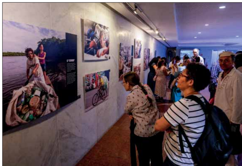
EVENTO – Produzida por fotógrafos e repórteres da Alepe, exposição ficará aberta ao público até o final de setembro

"A exposição traz fotos que retratam diversos mo-