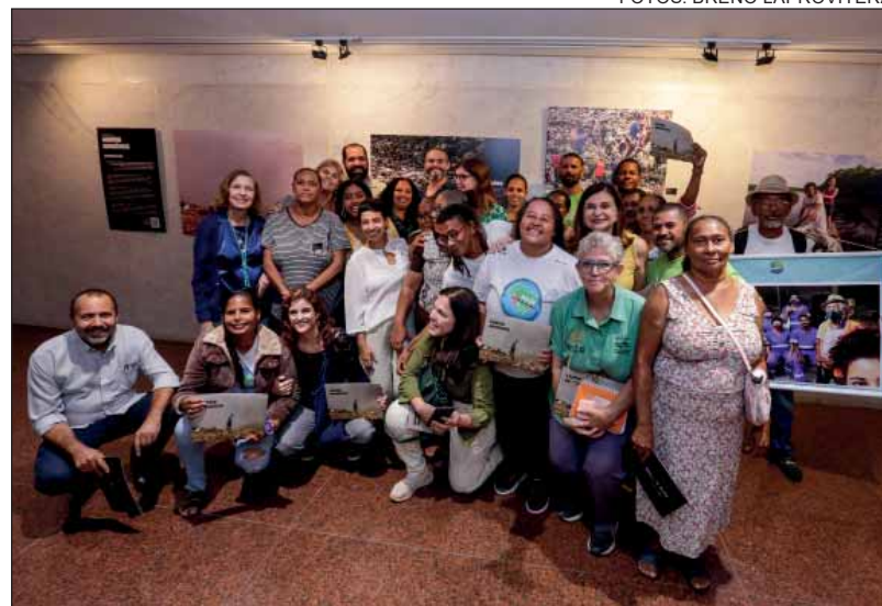
VISIBILIDADE – Representantes de associações e cooperativas de catadores comemoraram o reconhecimento da categoria