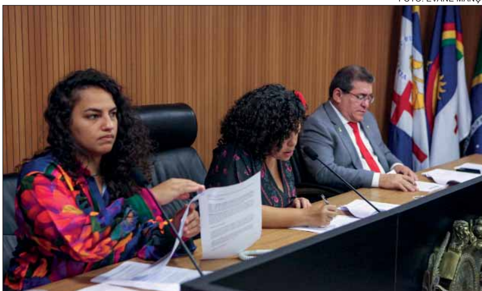
CIDADANIA – Colegiado aprovou matérias a favor dos trabalhadores resgatados de condições análogas à escravidão

Já o PL nº 1106/2023 reajusta os repasses do Programa Estadual de Transporte Escolar (Pete). Os valores, que variam