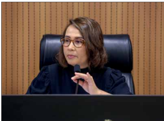
EMENDAS – Segundo Débora Almeida, alterações mostram um fortalecimento das bases locais