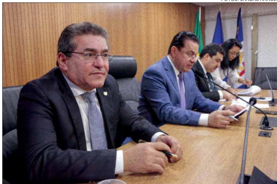
PESSOA COM DEFICIÊNCIA – Comissão de Saúde divulgou datas da semana dedicada ao segmento