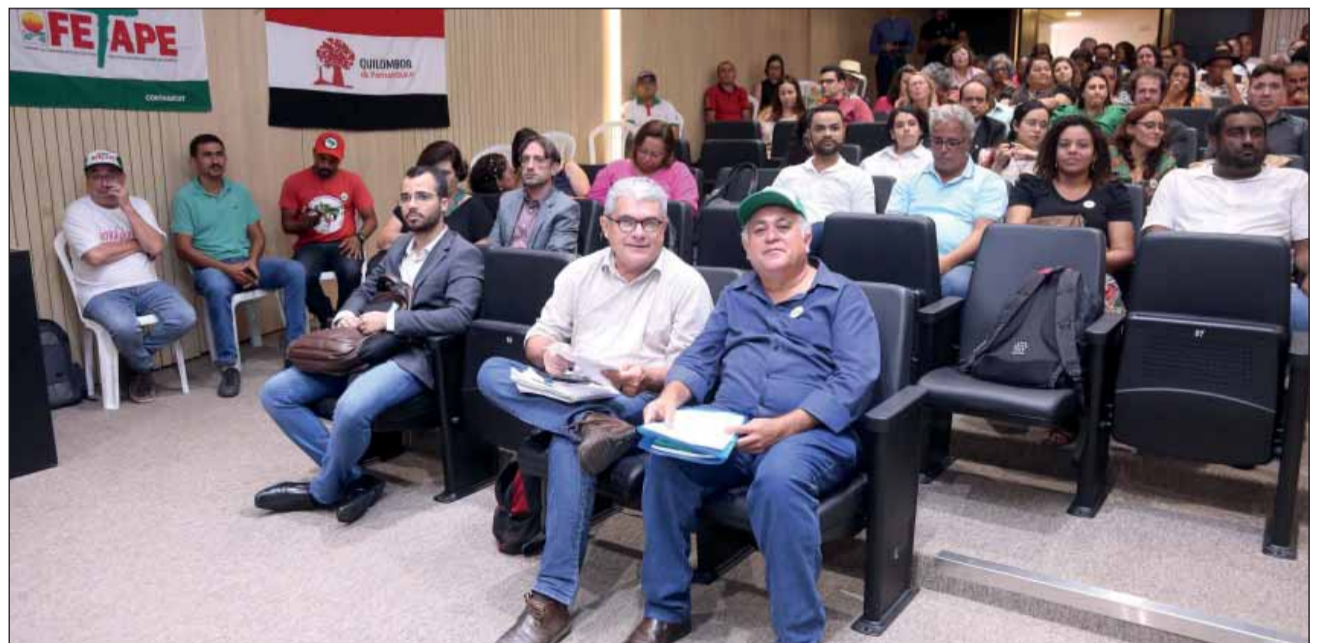
PRONERA – Em audiência, a Comissão debateu sobre os 25 anos do Programa Nacional de Educação na Reforma Agrária