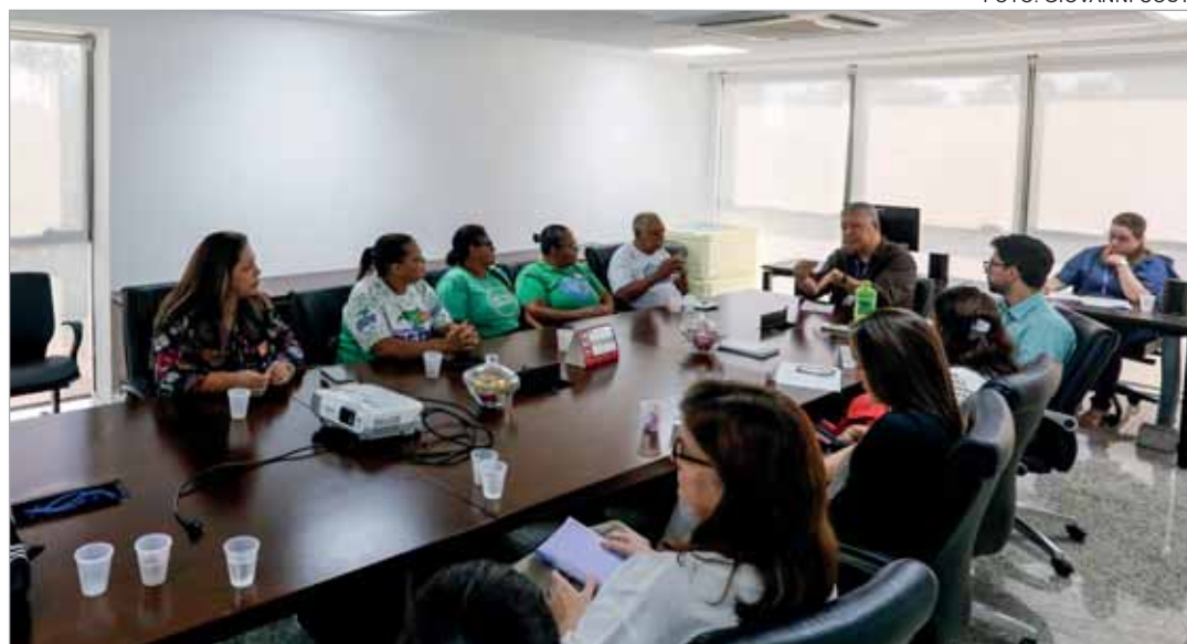
DIÁLOGO – Grupo de Trabalho da Alepe recebeu demandas de catadores e discutiu com especialistas

“A participação dos catadores no processo de coleta seletiva, além de gerar empre-