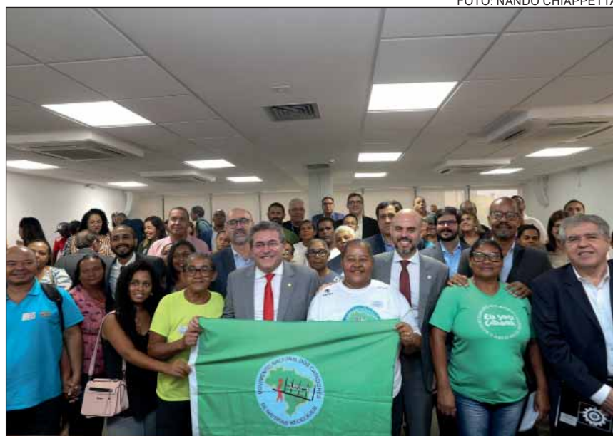
PROTAGONISMO – Direito dos catadores a remuneração adequada foi destaque no evento do Dia do Meio Ambiente

operativas. Ele avalia como positivas iniciativas nesse sentido implementadas em Jaboatão dos Guararapes e Abreu e Lima, na Região Metropolitana do Recife.