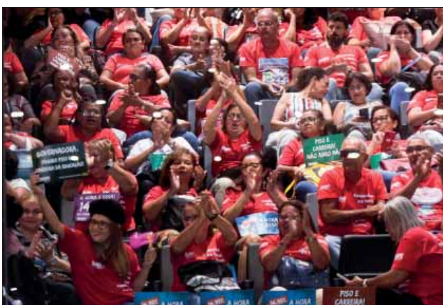
GALERIAS - Professores da rede estadual se manifestaram contra o PL 712 no Plenário

lhos, Aglailson Victor (PSB), primeiro vice-presidente da Alepe. Com isso, a presença dos deputados dos partidos e federações desses líderes não foram consideradas para quórum, o que impediu a deliberação.