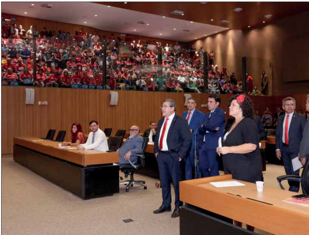
QUÓRUM – Obstrução de lideranças impediu votação de requerimento que poderia arquivar proposta do Governo

O pedido foi acatado pelo presidente dos traba-