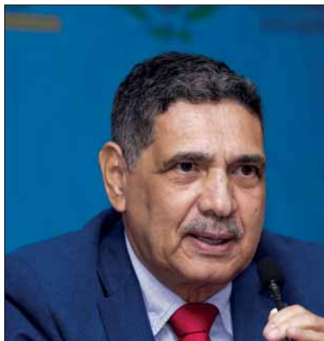
PROPOSTAS – João Paulo vai encaminhar audiência com TCE para tentar destravar licitação dos ônibus