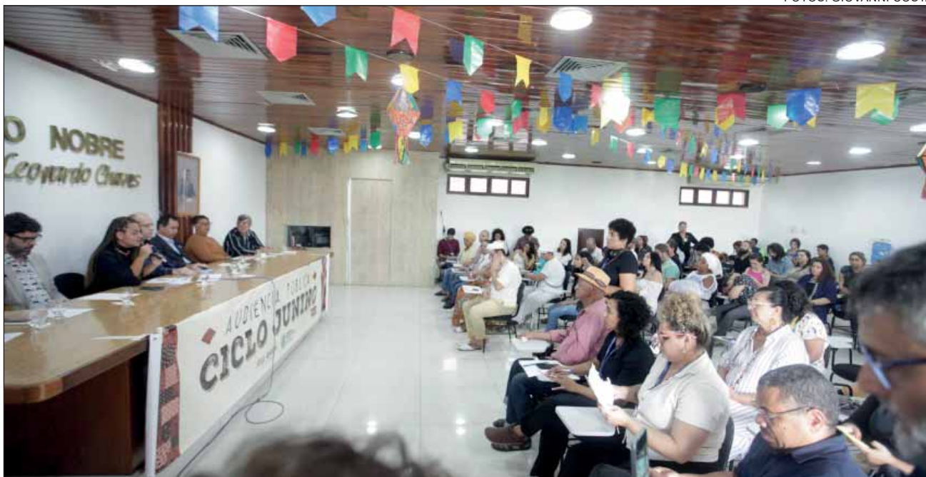
ESCUTA – Comissão da Assembleia Legislativa se reuniu em Caruaru para ouvir demandas do setor cultural junino