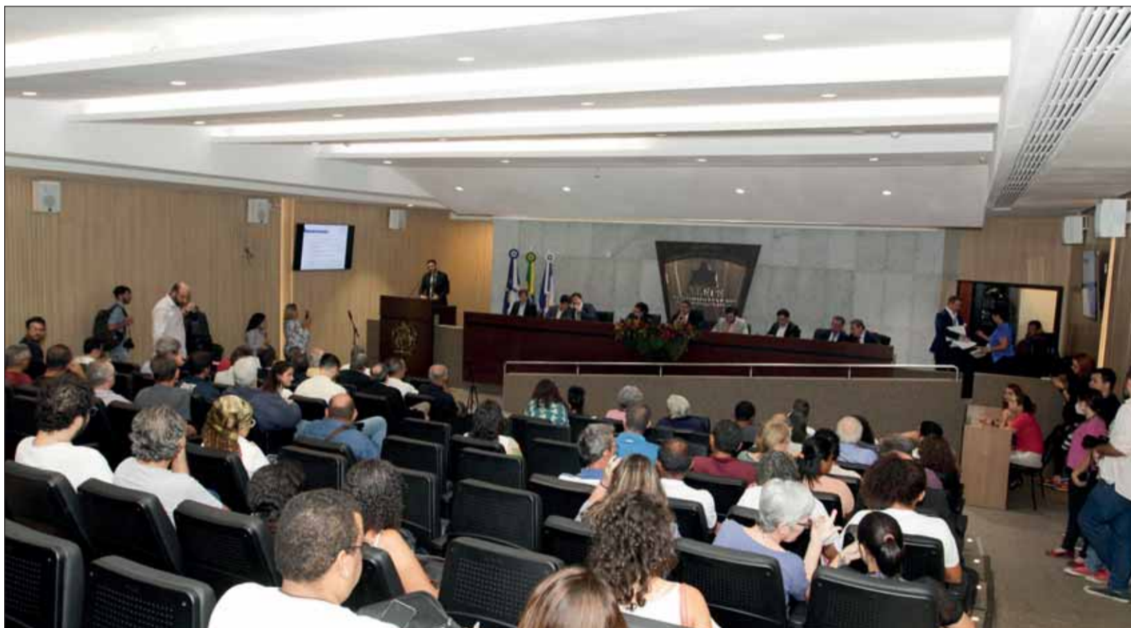
DESENVOLVIMENTO - Parlamentares, empresários e representantes de entidades debateram a importância da ferrovia para a economia de Pernambuco