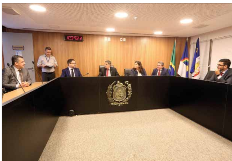
REUNIÃO - Colegiado ouviu ontem uma explanação do secretário estadual de Desenvolvimento Econômico

O secretário esclareceu também que o estudo de viabilidade da obra usado para embasar a mudança de traçado não aponta necessariamente para a exclusão do eixo até Suape. Segundo ele, a decisão foi uma dentre as várias possibilidades apontadas no documento, que analisava