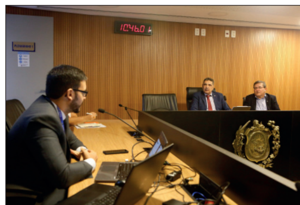
ANÁLISE - Parecer da Consultoria Legislativa aponta pontos controversos na mudança do projeto original

O levantamento sugere diversos pedidos de informação, como cópias dos processos do TCU referentes à Transnordestina, e de documentos da Agência Nacional de Transportes Terrestres (ANTT). O texto também recomenda reuniões com re-